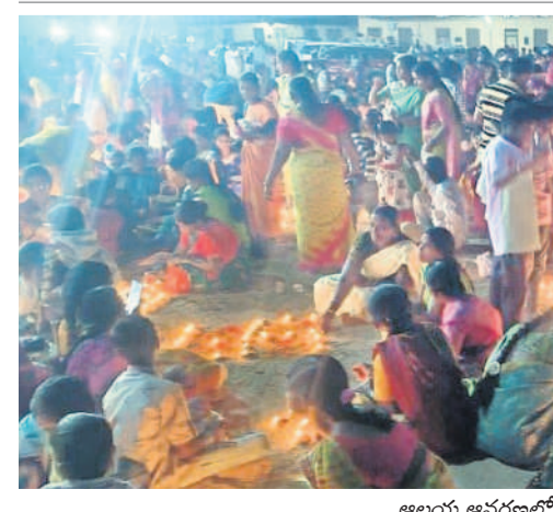
అలయ ఆవరణలో దీపాలు వెలిగిస్తున్న భక్తులు