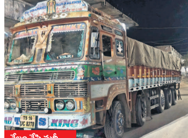
వేలం వేసి మరీ..