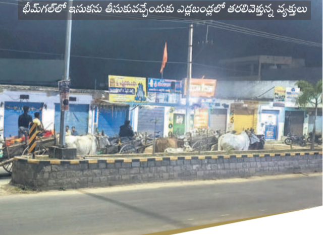
భీమగల్లో ఇసుకను తీసుకువచ్చేందుకు ఎడ్లబండ్లలో తరలింపు వృక్తులు

భీమగల్లో జోరుగా.. భీమగల్ మండలంలోనూ అక్రమ దండాకు అడ్డే లేదు. పాక్షియన్లు పెట్టి తోడేయడం ఒక ఎత్తయితే, ఎడ్లబండ్లపై తీసుకెళ్లిన దంపి చేసి అమ్ముకోవడం మరో ఎత్తు. బదాభీమగల్, భీమగల్ గ్రామాల్లో ఇసుక రవాణాకు ప్రభుత్వ అనుమతి ఉండగా, బెజ్జోరాలో మాత్రం అనుమతి లేదు. కానీ, ఈ గ్రామంలో అక్రమంగా రెండు ఇసుక పాయింట్లు ఏర్పాటు చేశారు. ఒక్కో పాయింట్ వద్ద వంద రోజులు తవ్వకునేందుకు రూ.7.50 లక్షల చొప్పున ఒప్పందం కుదిరినట్లు తెలిసింది. బెజ్జోరా నుంచి పాక్షియన్లతో ఇసుకను తోడేస్తున్నా అధికారులు మాత్రం కిమ్మనడం లేదు. అనుమతి ఉన్న భీమగల్, బదాభీమగల్ ఇసుక పాయింట్ల నుంచి ఒకే వే బిల్లుపై రెండు మూడు సార్లు ఇసుకను తరలిస్తున్నట్లు సమాచారం. భీమగల్లో అయితే ఎడ్లబండ్లపై ఇసుకను తరలింపి ఇతరులకు విక్రయించుకుంటారు. వీరికి వేబిల్లులు కూడా ఆవసరం లేదు. ఇలా అమ్ముకున్న ఇసుకను రాత్రిలో లారీల్లో తరలింపి ఒక్కో లారీ రూ.45 వేల నుంచి రూ.60 వేల వరకు రట్టణాల్లో విక్రయించుకుంటున్నారు. దీనిపై స్థానికులు కొందరు జిల్లా అధికారులకు ఫిర్యాదు చేసినా స్పందన లేకుండా పోయింది.