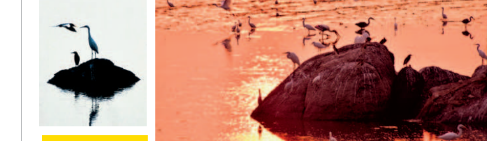
చేపలు భోజి.. కొంగల ఆకలి!

భద్రకాళి చెరువులో వలకు చిక్కిన చేపలను బయటకు తీస్తున్న మత్స్యకారులు