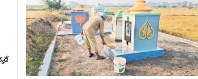
ములుగులో మాజీ సర్పంచ్ భర్త సోదరుడి సమాధిని శుభ్రం చేస్తున్న జీపీ కార్యకుడు