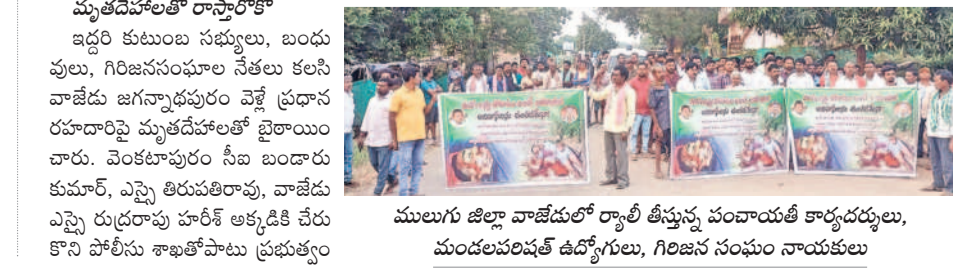
ములుగు జిల్లా వాజేడులో ర్యాలీ తీస్తున్న పంచాయతీ కార్యదర్శులు, మండలంపైకి ఉద్దేశాలు, గిరిజన సంఘం నాయకులు