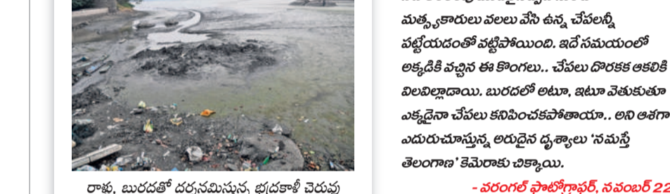
రాళ్ల, బురదతో దర్శనమిస్తున్న భద్రకాళి చెరువు