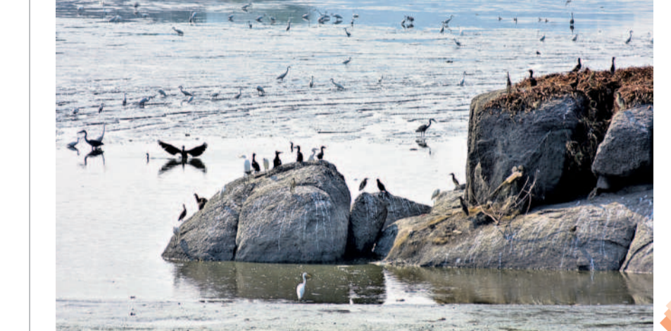
వరంగల్ భద్రకాళి చెరువులో చేపల కోసం ఎదురుచూస్తున్న కొంగలు