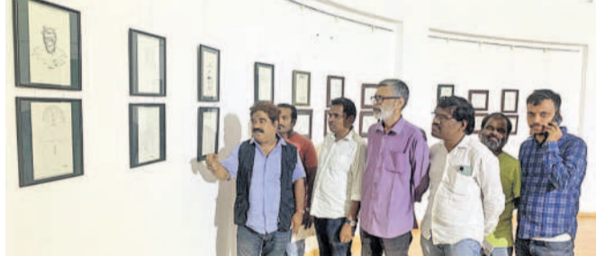
మాదాపూర్లోని బిత్తము స్టేట్ ఆర్ట్ గాలరీలో జనమార్చిలో నెహ్రూ ఫైన్ ఆర్ట్స్ యూనివర్సిటీ కల్చరల్ విభాగం హెచ్.డి.ఎస్.కాంపెయిన్ ఏర్పాటు చేసిన డ్రాయింగ్ ఎగ్జిబిషన్ శుక్రవారం ప్రారంభమయింది. ఈ ప్రదర్శన ఈనెల 23వ తేదీ వరకు కొనసాగుతుందని, ఇందులో 42 డ్రాయింగ్స్ ను సందర్శనకు ఉపనివేషణ నిర్వహణలు తెలిపారు. - కొండాపూర్, నవంబర్ 22