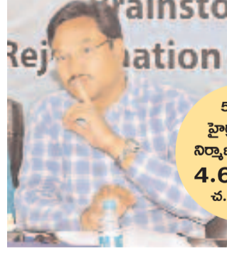
5 నెలల్లో హైద్రా కమిషన్ నిర్మాణ పరిమోక్షం 4.65 లక్షల చ. అడుగులు