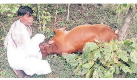
అడవిలోని తాజాగా శివారులో అక్టోబర్ 26న పులి దాడిలో గాయపడ్డ అవు

అటవీ శాఖ అధికారుల గణాంకాల ప్రకారం.. అసిఫాబాద్ జిల్లా అడవుల్లో పది నుంచి 12 పెద్ద పులులు స్థిర నివాసం ఏర్పాటు చేసుకున్నాయి. వీటిలో రెండు అడవి పులులు, ఏడు మగ పులులు ఉన్నాయి. మహారాష్ట్ర నుంచి రెండు పులులు వచ్చాయి. దీంతో ఇప్పుడు కొత్తగా వచ్చిన మగ పులులకు ఇక్కడ అడవిలోకి అవకాశాలు ఉన్నాయని అధికారులు భావిస్తున్నారు. ఈ మేరకు వచ్చిన పులులు ఇక్కడే అడవుల్లోనే కొంతకాలం ఉండి చాన్స్ ఉంటున్నాయి. పులులు వైల్డ్ ఎనిమల్స్ అయిపోతుంటే ప్యామెటికీ అత్యంత ప్రాధాన్యం ఇస్తారు. అడవిలోని కలిసి పిల్లల్ని కన్నా ప్రస్తుతం అవి ఉంటున్న టెరిటోరిని వారసత్వంగా పిల్లలకు అప్పగించి అవి వేరే చోటుకు వెళ్లిపోతాయి. పులి పిల్లల పెరిగి, స్వయంగా వేట నేర్చుకునే వరకు వాటినే అంటిపెట్టుకుని ఉంటాయని అధికారులు చెప్పారు. ఈ క్రమంలోనే అడవిలో కొనసాగిస్తున్న అసిఫాబాద్ తీవ్రంగా ఉంటుంది. అడవిలో అడవిలో తిరుగుతూ దాని శరీరం నుంచి ఒక ప్రత్యేకమైన సెంట్నెంట్ రిలీజ్ చేస్తాయి. ఆ స్మెల్ను మగ పులులు 100 కిలోమీటర్ల దూరంలో ఉన్నా పనిగడుతాయని అధికారులు చెప్పారు. నిర్మల్, ఆదిలాబాద్ లో తిరిగిన జాన్ ఆన్ పెద్దపులి, మంచి ర్యాలలో సంచరించిన ఎన్-12 పులి రెండూ ప్రస్తుతం అసిఫాబాద్ అడవుల వైపు వెళ్తున్నాయని అధికారులు అంచనా వేస్తున్నారు. మహారాష్ట్ర నుంచి వచ్చిన మగ పులి కూడా అసిఫాబాద్ లో అడవుల్లోనే మకాం వేసింది.