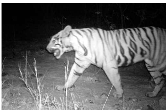
పాత మంచెర్యాలలో అటవీ ప్రాంతంలో సీన్ కెమెరాకు చిక్కిన పెద్దపులి(ఫైల్)