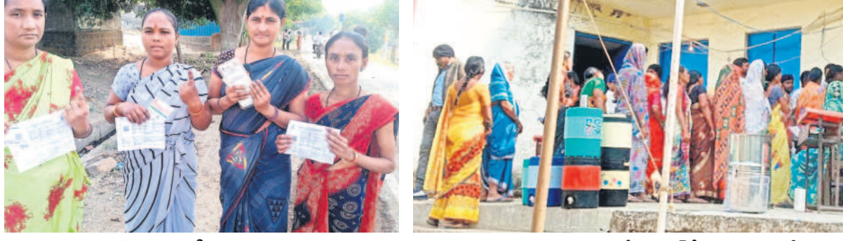
ఓటు హక్కు వినియోగించుకున్న మహిళలు

కుటుంబ సంఘం అసిఫాబాద్, నవంబర్ 20 (నమస్తే తెలంగాణ) మహారాష్ట్రలో బుధవారం జరిగిన అసెంబ్లీ ఎన్నికల్లో తెలంగాణ-మహారాష్ట్ర సరిహద్దులోని వివాదాస్పద ప్రాంతంలోని కెరమెరి మండలానికి చెందిన 12 గ్రామాల ఓటర్లకు తమ ఓటు హక్కు వినియోగించుకున్నారు. మహారాష్ట్రలోని చంద్రాపూర్ జిల్లా రాజూరా అసెంబ్లీ నియోజకవర్గ పరిధిలో ఏర్పాటు చేసిన పోలింగ్ కేంద్రాల్లో ఓట్లు వేశారు. కుటుంబ సంఘం అసిఫాబాద్ జిల్లా కెరమెరి మండలంలోని 12 గ్రామాల ప్రజలు రెండు రాష్ట్రాల్లో జరిగే ప్రతి ఎన్నికల్లో ఓటు హక్కు వినియోగించుకుంటున్నారు. గత