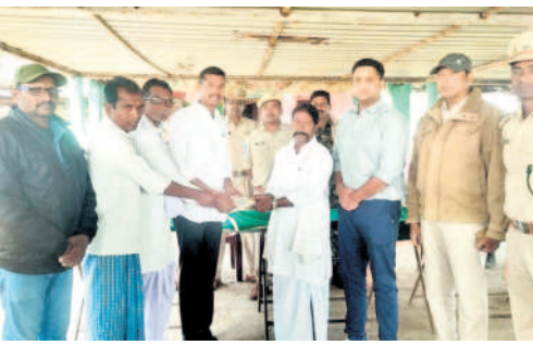
పులి దాడిలో చనిపోయిన పశువు యజమాని కి నష్టపరిహారాన్ని అందిస్తున్న అటవీ శాఖ అధికారులు, నాయకులు