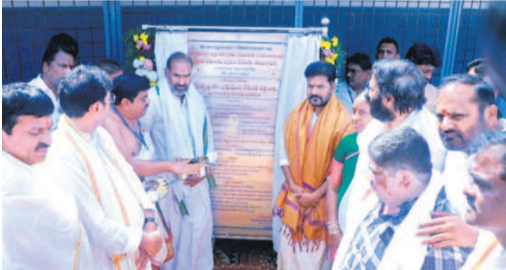
రాజన్న ఆలయంలో అభివృద్ధి పనుల శిలాఫలకాన్ని ఆవిష్కరిస్తున్న సీఎం రేవంత్ రెడ్డి, మంత్రులు

వేములవాడ, నవంబర్ 20: ముఖ్యమంత్రి రేవంత్ రెడ్డి బుధవారం వేములవాడకు వచ్చారు. రాజన్న ఆలయ అభివృద్ధికి ₹76కోట్ల నిధులు విడుదల చేస్తూ ప్రభుత్వం జీవో జారీ చేయగా, స్వామివారి దర్శనగౌరవం వద్ద ఈశాన్య ప్రాంతంలో ఆలయ విస్తరణ అభివృద్ధి పనులకు భూమి పూజ చేశారు. శిలాఫలకాన్ని ఆవిష్కరించారు. ఆలయ ఆవరణలో స్వామివారి ఆలయ అభివృద్ధి చాయాచిత్ర ప్రదర్శనను తిలకించారు. అక్కడి నుంచి రాజన్న ఆలయానికి చేరుకోగా, ఆలయ అర్చకులు పూజకంధ స్వాగతం పలికారు. ఆనంతరం సీఎం రేవంత్ రెడ్డి చెల్లించు కుని స్వామివారి ఆనుబంధ ఆలయాల్ని బాల రాజేశ్వర స్వామి, కాలభైరవుడిని దర్శించుకున్నారు. ఆ తర్వాత స్వామివారి ఆలయంలో ప్రత్యేక పూజలు చేశారు. అద్దాల మండపంలో