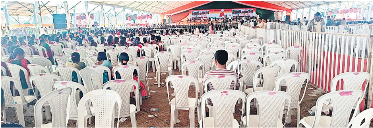
వేములవాడ గుడిచెరువు వద్ద ఏర్పాటు చేసిన సభలో ముఖ్యమంత్రి రేవంత్ రెడ్డి మాట్లాడుతుండగా ఖాళీగా దర్శనమిస్తున్న కుర్చీలు

వేములవాడ, నవంబర్ 20: ప్రజాపాలన ప్రజా విజయా త్వణాల పేరిట బుధవారం వేములవాడలో సీఎం రేవంత్ రెడ్డి సభ నిర్వహించారు. గుడిచెరువులో ఏర్పాటు చేసిన ఈ సభకు మహిళలను పెద్దసంఖ్యలో తరలించారు. సీఎం రాజన్న సన్నిధిలో ప్రత్యేక పూజలు చేసి, మధ్యాహ్నం 1.25 గంటలకు సభా స్థలానికి చేరుకున్నారు. దాదాపు గంట 20 నిమిషాలపాటు మంత్రులు ఉపోద్ఘాటాన్ని ప్రదర్శించారు. ఆ తర్వాత రేవంత్ రెడ్డి మరో 37 నిమిషాల ప్రసంగించారు. అయితే ఎన్నికల ముందు ఆకర్షించే మాటలు మాట్లాడిన ఆయన, అధికారంలోకి వచ్చిన తర్వాత కూడా చేసిన అభివృద్ధి గురించి చెప్పకుండా ఇతరులను విమర్శించడంపైనే ప్రసంగం చేశారు. అప్పటికే సమావేశానికి బలవంతంగా వచ్చిన మహిళలు, ప్రజలు మంత్రుల ప్రసంగాల నుంచే ఒక్కొక్కరిగా బయటకు వెనుదిరిగారు. అక్కడ విధులు నిర్వహిస్తున్న అధికారులు, పోలీసులు సైతం వారిని బెదిరించి కూర్చోబెట్టేందుకు ప్రయత్నించారు. అయినా అగతపోగా, సీఎం ప్రసంగం పూర్తికాక ముందే సగం ఖాళీ అయింది. ముందు మంది కనిపించినా చివరలో మాత్రం కుర్చీ లన్నీ ఖాళీగా దర్శనమిచ్చాయి.