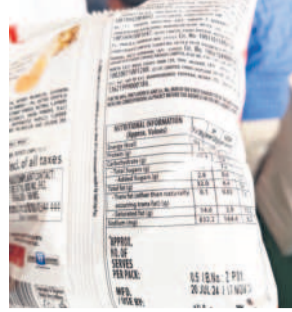
వేములవాడ సీఎం సభలో అందించిన కాలం చెల్లిన బిస్కెట్ ప్యాకెట్

వేములవాడ, నవంబర్ 20: సాక్షాత్తు ముఖ్యమంత్రి రేవంత్ రెడ్డి వేములవాడ సభలో మీడియా ప్రతినిధులకు కాలం చెల్లిన ఆహార పదార్థాలను అందించారు. కవరేజీకి వచ్చిన మీడియా మిత్రులకు బిస్కెట్లు, ఆలు బిస్కెట్లు, తాగునీటి ప్యాకెట్లను పౌర సంబంధాల అధికారులు అందజేశారు. అయితే ఆలు బిస్కెట్లు 17వ తేదీకే గడువు ముాయగా, సగం వరకు తిన్న మీడియా ప్రతినిధులు కంగారుపడ్డారు. గడువు దాటిన ఆహార పదార్థాలను ఎలా అందిస్తారని ఆగ్రహం వ్యక్తం చేశారు. వెంటనే సంబంధిత ఆహార తనిఖీ అధికారులకు సమాచారం ఇవ్వగా, ఆహార భద్రత అధికారి ఆనామ్ సిరిసిల్ల రోని మజిలీకంట్ ఏజెన్సీలో తనిఖీలు చేశారు. గడువు దాటిన రూ.8,100 విలువైన ఆహార పదార్థాలను సీజీ చేసి యజమానిని కేసు నమోదు చేశారు.