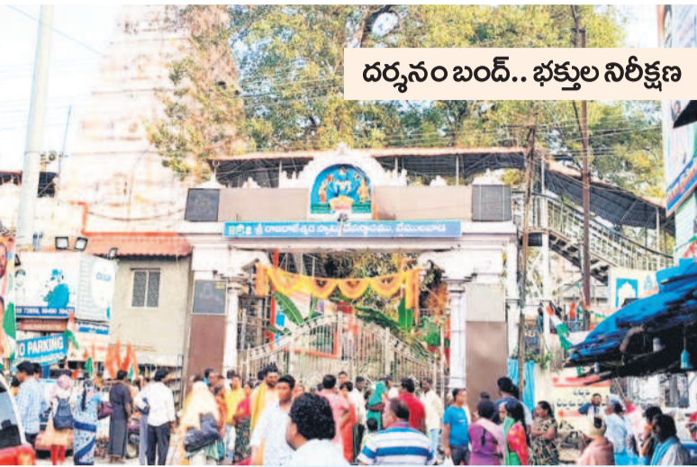
రాజన్న ఆలయ ప్రధాన ద్వారం గేటు ఎదుట భక్తులు