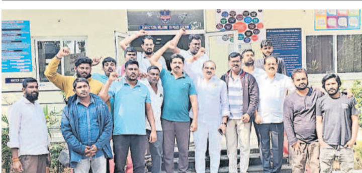
సిరిసిల్ల టౌన్ హాల్లో స్టేషన్ ఎదుట నిరదిస్తున్న బీఆర్ఎస్ నాయకులు

వేములవాడ, నవంబర్ 20: ముఖ్యమంత్రి రేవంత్ రెడ్డి బుధవారం వేములవాడకు వచ్చారు. రాజన్న ఆలయ అభివృద్ధికి ₹76కోట్ల నిధులు విడుదల చేస్తూ ప్రభుత్వం జీవో జారీ చేయగా, స్వామివారి దర్శనగౌరవం వద్ద ఈశాన్య ప్రాంతంలో ఆలయ విస్తరణ అభివృద్ధి పనులకు భూమి పూజ చేశారు. శిలాఫలకాన్ని ఆవిష్కరించారు. ఆలయ ఆవరణలో స్వామివారి ఆలయ అభివృద్ధి చాయాచిత్ర ప్రదర్శనను తిలకించారు. అక్కడి నుంచి రాజన్న ఆలయానికి చేరుకోగా, ఆలయ అర్చకులు పూజకంధ స్వాగతం పలికారు. ఆనంతరం సీఎం రేవంత్ రెడ్డి చెల్లించు కుని స్వామివారి ఆనుబంధ ఆలయాల్ని బాల రాజేశ్వర స్వామి, కాలభైరవుడిని దర్శించుకున్నారు. ఆ తర్వాత స్వామివారి ఆలయంలో ప్రత్యేక పూజలు చేశారు. అద్దాల మండపంలో