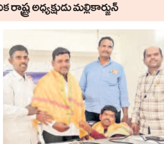
సంఘం రాష్ట్ర అధ్యక్షుడిని సన్మానిస్తున్న దివ్యాంగుల సంఘ నేతలు