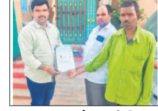
చెక్కు అందజేస్తున్న మహిళా