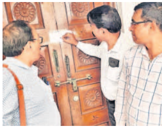
సిద్దిపేటలోని ఓ ప్రైవేట్ దవాఖానను సీజ్ చేస్తున్న జిల్లా వైద్య ఆరోగ్యశాఖ అధికారులు