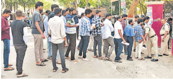
సిద్దిపేట ప్రభుత్వ డిగ్రీ కళాశాలలో క్యూలో ఉన్న గ్రూం-3 అభ్యర్థులను తనిఖీ చేసే వంటిస్తున్న పోలీసులు

మాల్సినా, వైద్యుల పేరు మార్చినా జిల్లా వైద్య అధికారి గారితో తెలిపాలన్నారు. ప్రతి నెల 5వ తేదీలోగా హెల్త్ సెంటర్ పోర్టల్ అప్డేట్ చేసుకోవాలని సూచించారు. తనిఖీ పోర్టల్ క్లినిక్, గురు సాయి కలెజ్ దవాఖానలను సీజ్ చేసినట్లు తెలిపారు. దవాఖాన పేరు