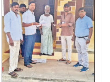
మద్దూరులో 60 శాతం సర్వే పూర్తి

హుస్సేనాబాద్ లో, నవంబర్ 20 : రాష్ట్ర ప్రభుత్వం చేపట్టిన కులగణన సర్వే పట్టుణ్ణి సోమవారం ఈజిఎస్ సామాజిక తనిఖీ ప్రజావేదికలోని 20 వార్డుల్లో నిర్వహిస్తున్న గణన సర్వేలో భాగంగా ఇంటింటికీ వెళ్లి ఉపాధ్యాయులు, వార్డు అధికారులు, మొత్తం ఆర్టీలు ప్రజల నుంచి సమాచారాన్ని సేకరించారు. ము వివరాల నమోదు తీరును పలువురు సూపర్వైజర్లు ఎప్పటికప్పుడు పరీక్షిస్తున్నారు.