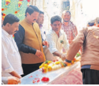
బాధితు కుటుంబ సభ్యులను పరామర్శిస్తున్న మాజీ ఎమ్మెల్యే సార్వజనీన్

రాయపాల్, నవంబర్ 18 : పేదలకు తాను ఎల్లావుడు అండగా ఉంటామని మాజీ ఎమ్మెల్యే పరమామోహన్ అన్నారు. సోమవారం రాయపాల్ మండల కేంద్రంలో అనారోగ్యంతో హామీ కార్యక్రమం పంపించిన రమణ్ పాటు ఇటీవల అతిక ఇబ్బందులతో అత్యంత వ్యతిరేకంగా ఉన్నట్లు రాములు కుటుంబాలను పరామర్శించారు. మండలంలోని మంతూర్ గ్రామానికి చెందిన పడిగే సర్పంచులు గుండెపోటుతో మృతి చెందగా, బాధితు కుటుంబాన్ని పరామర్శించారు. అదే గ్రామానికి చెందిన రేపల్లె ప్రమాదంలో మృతి చెందిన మహ్మద్ ఖాన్ కుటుంబ సభ్యులను పరామర్శించి, మృతి పట్ల బీదా విచారం వ్యక్తం చేశారు. ఆయన వెంట మాజీ జడ్పీటీసీ యాదగిరి, మండల మాజీకో-