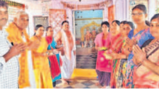
మద్దూరు (ధూళిమిట్ట), నవంబర్ 18

కార్తీక సోమవారం పురస్కరించుకొని మద్దూరు రామాలయంలో పూజలు చేస్తున్న భక్తులు