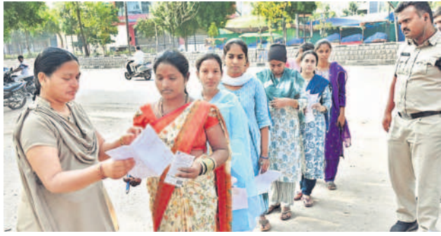
సిద్దిపేట బాంబు హైస్కూల్ లో మహిళా అభ్యర్థులను తనిఖీ చేసే వంటిస్తున్న పోలీసులు