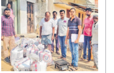
స్వాధీనం చేసుకున్న రేషన్ బియ్యంను చూపుతున్న అధికారులు