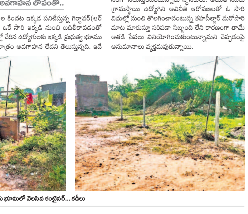
సర్కారు భూమిలో వెసిన కంటైనర్... కడీలు

దర్జాగా సర్కారు భూమి కబ్జా డి హెచ్ఎండ్ఎస్ 120లో యధేచ్ఛగా భూ ఆక్రమణలు.. పట్టణంకొని రెవెన్యూ అధికారులు దుండిగల్, నవంబర్ 18: కర్నూలులోని నియోజమాని కమిషనర్ గండిగల్ మండలంలో ప్రభుత్వ భూములు హారతికర్పారంగా కలిగిపోతున్నాయి. అధికార పార్టీ నేతల అండదండలతో అక్రమార్కులు రెవిన్యూను కొనసాగిస్తుండగా, అవగాహన లోపంతో రెవెన్యూ అధికారులు అటువైపు కన్నెత్తి చూడటం లేదనే విమర్శలు సర్కారు వినిపిస్తున్నాయి. కిందిస్థాయి సిబ్బంది ఒకరు నిర్మాణదారులతో కుమ్మక్కై నిర్మాణానికి ఓ రేటును నిర్ణయించి.. వసూలు చేయడంతో పాటు అధికారులకు అందుకో వాటా అందిస్తున్నట్లు తెలుస్తున్నది. తాజాగా మండల పరిధిలోని డి హెచ్ఎండ్ఎస్ 120/8లో ఓ వ్యక్తి 120/1 వేరిట ఉన్న ఇంటిపట్టణం అడ్డంకును సుమారు రూ .50లక్షల విలువైన 250 గజాల ప్రభుత్వ భూమిని ఆక్రమించేందుకు ప్రయత్నిస్తున్నట్లు తెలుస్తున్నది. రెండు, మూడు రోజులుగా సదరు స్థలంలో ఓ కంటైనర్ను ఏర్పాటు చేయడంతో పాటు చుట్టూ కడీలు వేయడం గమనార్హం. రెవెన్యూ కార్యాలయాలను