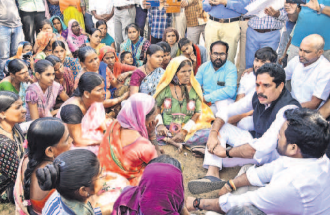
బాధితుల గోడు మింట్లను ఎన్సీ కమిషన్ సభ్యులు జాబోత్ పాస్పాసి నాణ్యత

మహబూబ్ నగర్ (నమస్తే తెలంగాణ ప్రతినిధి) / కొడంగల్, నవంబర్ 18 : ‘ఆధ్మరేత్రి యమునోళ్లొచ్చినట్టు వచ్చి మా మొగోళ్లు యాడున్నారో, ఏమైనారో తెల్యదు: కమిషన్ ముందు బాధితులు’ అనే బలవంత కోరికను తెలుపుతూ.. ఆళ్ల జాడ ఎక్కడో తెల్యదు.. అసలు బతికే ఉన్నారా? లేదా అని గుబురైపోయింది.. అప్పటి నుంచి పిల్లలెళ్లు, ముసలి ముతక అందరికీ ఆకలి రిచ్చులు కరువైనయ్యాయి! రాత్రియే నిద్రనేడే దూరమైంది.. పోలీసులు వస్తున్న అంటే గుండ్లెళ్లు గుబులు పుడుతుంది.. ఊళ్ల నించి ఒక్కలు కూడా పనులతో పోతే.. పిల్లలెళ్లు బడికి పోతే.. బువ్వ బెట్ల భూములయ్యవస్తున్నాయో మాకో గతి.. మళ్లీ మా వోళ్లు (మొగోళ్లు) ఊళ్లొచ్చిన మా బాధ తీర్చింది. అప్పటిదాకా మాకోడి గతి.. ఎట్టుయినా మా వోళ్లను రిచ్చులు తెచ్చుకోవాలి అంటూ సోమవారం పర్యటించిన ఎన్సీ జాతీయ కమిషన్ బృందం ఎదురు బాధపర్చి, రోజీబండ తండ సమీప గ్రామాల కాపాడి కుటుంబాలు తమ గోడు వెళ్లబోతున్నారని, కన్నీటి పర్యంతమై సుందరించిన జాతీయ ఎన్సీ కమిషన్ బృందం సోమవారం లగచర్ల, రోజీబండ తండలో పర్యటించింది. మధ్యాహ్నం ఒకటిన్నరకు రోజీబండ తండకు చేరుకున్న జాతీయ ఎన్సీ కమిషన్