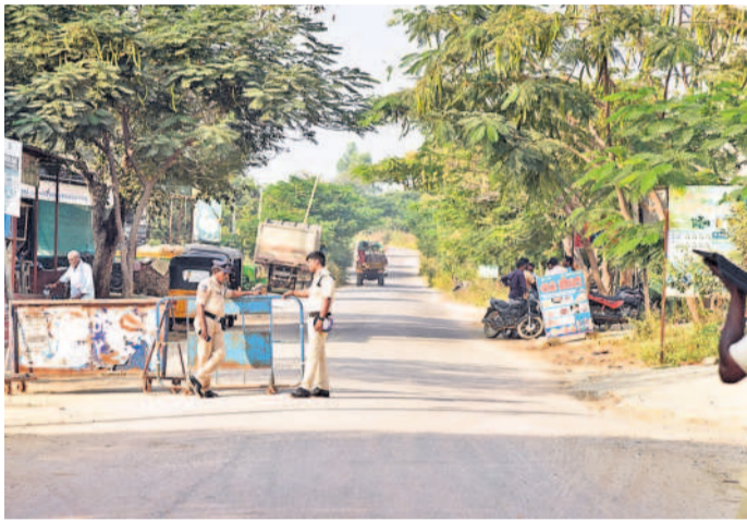
పోలీసుల పహారాలో నిర్మాణవ్యూహం ఉన్న లగచర్ల

హైదరాబాద్, నవంబర్ 18 (నమస్తే తెలంగాణ) : ముఖ్యమంత్రి రేవంత్ రెడ్డి ప్రాతినిధ్యం వహిస్తున్న కొడంగల్ నయోజనవర్గంలోని లగచర్ల, ఆ చుట్టూరూతుల తండ్రిలో ఈ నెల 11న అర్ధరాత్రి కరంట్ తీసి పోలీసులు, కొందరు ప్రైవేట్ వ్యక్తులు సాగించిన అరాచకంపై జాతీయ మహిళా కమిషన్ తీవ్రస్థాయిలో ఆగ్రహం వ్యక్తం చేసింది. బాధితుల గోడ ప్రక్క క్షణం విన్న తర్వాత పోలీసుల వ్యవస్థాత్మక లక్ష్యాన్ని తీవ్రంగా మండిపడింది. లగచర్లకు చెందిన పలువురు బాధితులు సోమవారం ఢిల్లీలో జాతీయ మహిళా కమిషన్, జాతీయ మానవ హక్కుల కమిషన్, జాతీయ ఎన్సీ కమిషన్, జాతీయ ఎన్టీ కమిషన్ల వద్దకు వెళ్లి తమకు జరిగిన అన్యాయంపై నేరగా ఫిర్యాదు చేశారు. ఉదయం మానవ హక్కుల కమిషన్ వద్దకు వెళ్లిన తర్వాత మహిళా కమిషన్ వద్దకు వెళ్లిన బాధితులు.. తమ భూములను అన్యాయంగా గుంజుకుంటున్నారని, తిరగబడిన రైతులపై ధర్మ దీగ్రి ప్రయోగిస్తున్నారని, అర్ధరాత్రి కరంట్ తీసి పోలీసులు తమ గిరిజన బిడ్డలపై అసభ్యంగా ప్రవర్తించారని కన్నీటి పర్యంతమయ్యారు. అధ్యక్షులను మహిళలపై అర్ధరాత్రి పోలీసులు లాఠీలతో దాడులు చేశారని ఫిర్యాదు చేశారు. ఈ సందర్భంగా వారు కేసుల గురించి