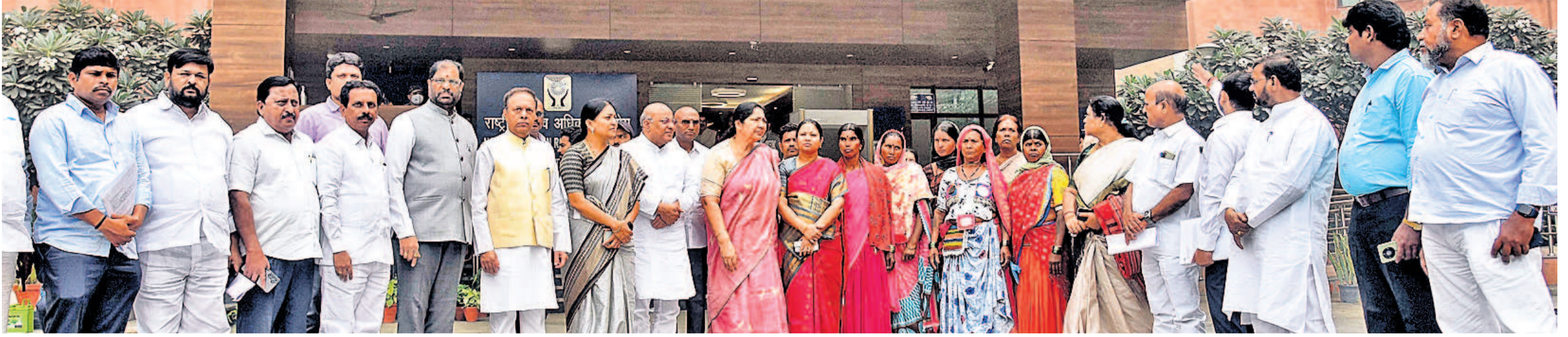
సోమవారం ఢిల్లీలో ఎన్సీ, ఎన్టీ, మానవ హక్కుల కమిషన్లను కలిపిన బీఆర్ఎస్ బృందం, లగచర్ల బాధితులు