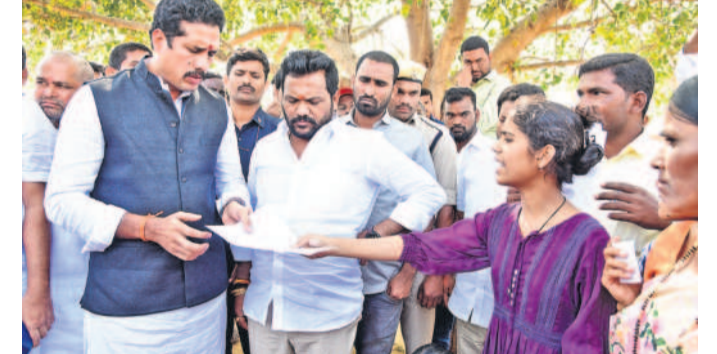
పెయిడ్ బ్యాచ్ అని హాళన చేస్తున్నాం..

గట్టిగా వార్నింగ్ ఇచ్చారు. మా సమాధుల మీద శంకుస్థాపన చేయి.. మేము భూములపైనే ఆధారపడినాం, అవే పోతే మా బతుకులు ఆగిపోతాయి. సర్కారు ఇవ్వాలి లాక్సోని ఉద్దేశ్యాలను, ఇంట్లోపాతే పాలు రూ.10 లక్షలు ఇస్తామంటుంది. మాకు సదుపాయం లేదు.. ఏం ఉద్దేశ్యాలను ఇస్తారు, ఏవిధంగా బతకాలి.. అని బాధిత గ్రామాల ప్రజలు కమిషన్ ఎదురు తల వేసినా వ్యక్తం చేశారు. ప్రభుత్వం పట్టుదలకు పోతే మేము సర్కారు మా సమాధుల మీద శంకుస్థాపన చేయండి’ అంటూ కమిషన్ ముందు గోసరిల్లారు. ‘సంఘటన స్థలంలో లేని వాళ్లను సైతం పోలీసులు ఎక్కడెక్కడో.. కొంత మంది భయం నీకే తండాల వదిలిపోయింది. ఏం జరిగినా మా భూముల్ని మాత్రం వదులుకోం.. అరెస్టు చేసిన మా మొగోళ్లను ఇడివి పెట్టండి’ అని వేడుకున్నారు. భూములు పోతయిన బాధతో తిండి, నిద్ర లేకుండా గడపుతున్నాం.. మా భూములు ఇవ్వబోమని కలెక్టర్లు, తాసిల్దార్లు, ఆర్డీవోను కలిసి చెప్పకున్నాం. ఇవ్వాలి అంటేనే మీటింగులు పెట్టి చాలా ఇబ్బందులకు గురి చేసింది.. అని చెప్పారు.