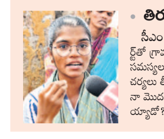
తిరుపతిరెడ్డికి ఏం అధికారం ఉంది?

సభ్యులు జాబోత్ పాస్పాసి నాణ్యత చూడ గానే కట్టులు తెంచుకున్న యుజుతో ఆయన కాళ్లపై బెడ్లారు. ముమ్మల్ని బతకలేదు.. అంటూ వేడుకున్నారు. దీంతో చలిచిన ఆయన గిరిజనులతోపాటు నేలపైనే కూర్చోని, వారి సమస్యలను సాధనాంగా విన్నారు. ‘డ పోరాంటం.. మా ఇష్టాలను గ్రహించాలి.. బలవంతంగా భూ సేకరణ చేపట్టవద్దు’ అంటూ వేడుకున్నారు. అన్యాయంగా భూములు లాక్సోని వారిని చూసి సహనంలేకుండా ఆగ్రహం వ్యక్తం చేశారు. పలానా కంపెనీ ఏర్పాటు చేస్తుంటూ