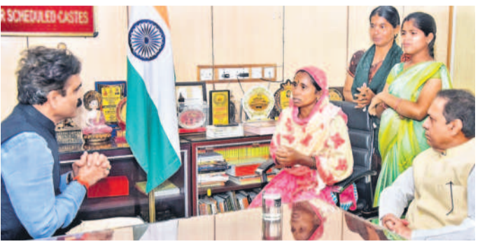
జాతీయ ఎన్సీ కమిషన్ వైరస్లకు తమ బాధలను వివరిస్తున్న లగచర్ల బాధితులు

గానికి లోనైస్తున్న తెలిసింది. జాతీయ ఎన్సీ కమిషన్ వద్ద.. మానవహక్కుల కమిషన్కు ఫిర్యాదు చేసిన తర్వాత బాధితులు నేరగా జాతీయ ఎన్సీ కమిషన్ వద్దకు వెళ్లి లగచర్లలో ఫిర్యాదు కంపెనీల బాధితులతో గిరిజనులతో పాటు ఎన్సీలు, డీజీపీల ఉన్నారని, అక్కడ అన్ని కులాల పట్ల జరుగుతున్న అత్యంత దారుణ ప్రవర్తనలను ఫిర్యాదు చేశారు. కమిషన్ సభ్యులు సైతం లగచర్ల పుటల, పోలీసుల ధర్మ దీగ్రి వివరాలు తెలుసుకున్నారు. బాధితుల పక్షంగా బీఆర్ఎస్ నేత, టుకు రానివ్వడం లేదని, ఒక వేళ బయట అడుగుపెడితే కొందరు ప్రైవేట్ వ్యక్తులు బైకెలు, గార్డల్తో తమను వెంటబెట్టుకుంటున్నారని కమిషన్ సభ్యులు తెలుసుకొని, బాధ్యులైన పోలీసులు, వారికి సహకరించిన ప్రైవేట్ వ్యక్తులపై తక్షణం చర్యలు తీసుకుంటామని హామీ ఇచ్చింది. లగచర్ల బాధితుల దుస్థితిని తెలుసుకొని, వారి గోడు విని, కమిషన్లను దెబ్బలు వేడియాలను చూసి కొందరు సభ్యులు కూడా తీవ్ర భావోద్వేగం