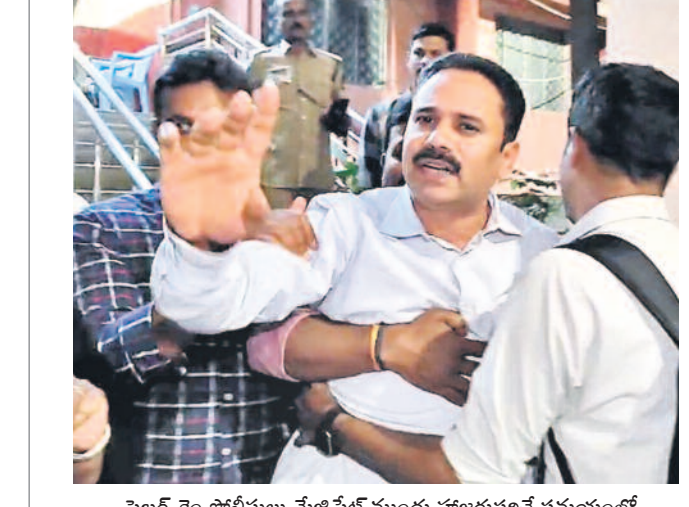
సైబర్ క్రైం పోలీసులు మేజిస్ట్రేట్ ముందు హాజరుచేసే సమయంలో మీడియాతో మాట్లాడుతున్న కోణతం దిల్లీ

అక్రమ అరెస్టు, రిమాండ్ ను తిరస్కరించిన న్యాయస్థానం ఆధారాలు లేకపోవడంతో కోర్టులో చేరు అనుభవాలు ఎన్ని కేసులు పెట్టినా ఇట్టే పోరాడుతూ: కోణతం దిల్లీ ఇందిరమ్మ రాజ్యమంటే ఎమ్మెల్యే రోజులైనా: కేటీఆర్ కక్షపూరిత ధోరణి మానుకోవాలి: మాజీ మంత్రి హరిశ్