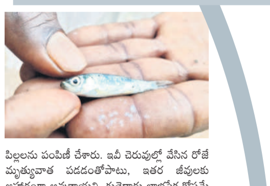
పిల్లలను పంపిణీ చేశారు. ఇవి చెరువుల్లో వేసిన రోజే మృత్యువాత పడడంతోపాటు, ఇతర జీవులకు అపహరణ అవుతాయని, గుత్తెదారు లాభవేష కోసమే తప్పా.. ఈ చిన్న సైజు పిల్లల వల్ల తమకు ఉపయోగం లేదని మత్స్యకారులు ఆరోపిస్తున్నారు. కాంట్రాక్టర్లను అడిగితే అధికారుల అనుమతితోనే పంపిణీ చేసినట్లు చెబుతున్నారు. అధికారులు, కాంట్రాక్టర్ కలిసి తమకు అన్యాయం చేస్తున్నారని మండిపడుతున్నారు.