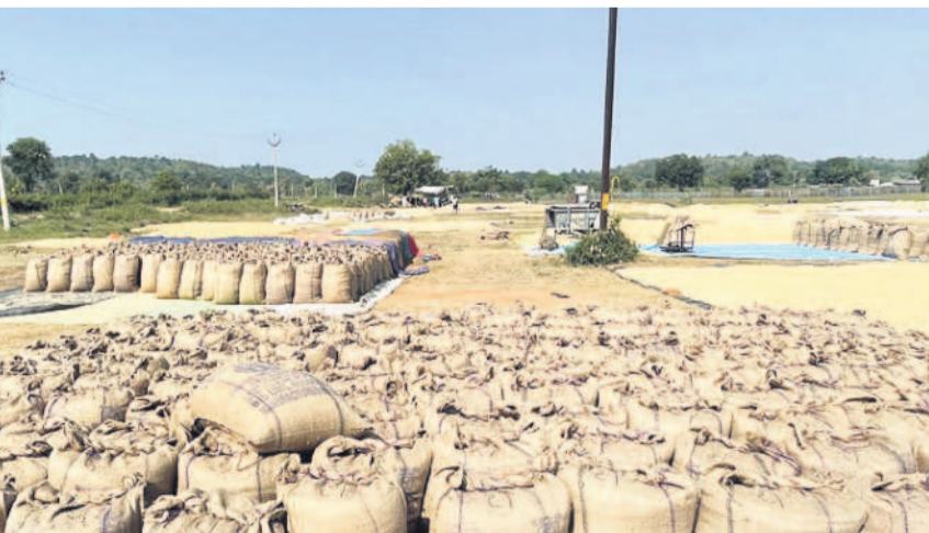
న్యూ లోలం కొనుగోలు కేంద్రంలో తూకం వేసి లాల్ గిరిజనం ఉంచిన ధాన్యం బస్తాలు