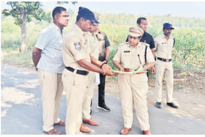
రాంసింగ్ తండా చెక్ పోస్టు లకార్యులను పరిశీలిస్తున్న ఎస్సీ జానకి పర్వల