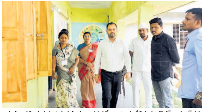
భూపాలపల్లి ప్రభుత్వ ఉన్నత పాఠశాల పరీక్ష కేంద్రాన్ని పరిశీలిస్తున్న కలెక్టర్ రాహుల్ శర్మ

భూపాలపల్లి రూరల్, నవంబర్ 17: గ్రూప్-3 పరీక్షలు ఆదివారం ప్రశాంతంగా జరిగాయి. భూపాలపల్లి జిల్లా కేంద్రంలోని ప్రభుత్వ ఉన్నత పాఠశాల, సంఘ మిత్ర కళాశాలలో పరీక్ష కేంద్రాలను కల్పించి పరీక్షలు నిర్వహించారు. ఈ సందర్భంగా కలెక్టర్ మాట్లాడుతూ పరీక్షల నిర్వహణలో నిబంధనలు పక్కాగా అమలు చేయాలని ఇన్చేజర్లకు, బీసీ సూపర్వైజర్లకు సూచించారు. జిల్లాలో గ్రూప్-3 పరీక్షల నిర్వహణకు 17 కేంద్రాలు ఏర్పాటు చేసి నట్లు తెలిపారు. మొత్తం 8707 అభ్యర్థులు గాను ఉదయం నిర్వహించిన పరీక్షలకు 2023 మంది, నాయంత్రం జరిగిన పరీక్షలకు 2020 మంది మూల్యే హాజరైస్తున్నట్లు తెలిపారు. కార్యక్రమంలో ఆర్డీవో మంగిలూర్, స్టాంక తహసీల్దార్ శ్రీనివాసులు, పరీక్షా కేంద్రాల సీనియర్ పాల్గొన్నారు.