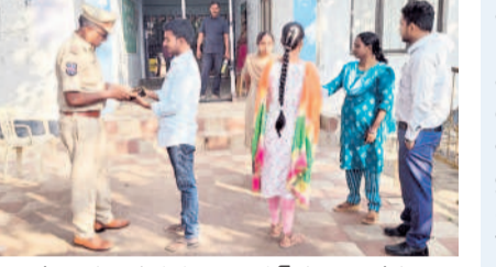
ములుగు : ప్రభుత్వ జూనియర్ కళాశాల వద్ద అభ్యర్థులను తనిఖీ చేస్తున్న పోలీసులు