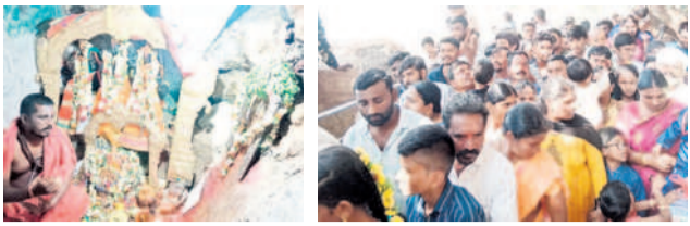
భూపాలపల్లి అధ్యక్షుడు దర్శనానికి బాబులబిలిం భక్తులు