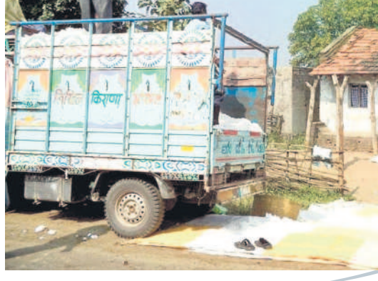
గ్రామాల్లో రైతుల ఇళ్ల వద్ద పత్తి కొనుగోళ్లు చేస్తున్న వ్యాపారులు

ఆసిఫాబాద్ జిల్లాలో ఈ ఏడాది 3.30 లక్షల ఎకరాల్లో పత్తి సాగు చేసినట్లు తెలుస్తుండగా, 23 లక్షల క్వింటాళ్ల దిగుబడి వస్తుందని యంత్రాంగం అంచనా వేస్తున్నది. ప్రభుత్వం ద్వారా జిల్లాలో సీసీవ ఆధ్వర్యంలో 14 జిన్సింగిల్ మిల్లులు ఉన్నప్పటికీ ఇంకా పూర్తిస్థాయిలో పత్తి కొనుగోళ్లు ప్రారంభించలేదు. దీంతో రైతులు తప్పనిసరి పరిస్థితుల్లో ప్రైవేట్ వ్యాపారులను ఆశ్రయించి నష్టపోవాల్సి వస్తున్నది. అయితే పత్తి కొనుగోళ్లు చేపడుతున్నారు. సీసీవ నిర్ణయించిన ధర క్వింటాలుకు రూ. 7521 ఉంటే.. వ్యాపారులు రూ. 6 వేల నుంచి రూ. 6500 వరకు మాత్రమే చెల్లింది కొంటున్నారు. దీంతో రైతులు రూ. వెయ్యి నుంచి రూ. 1500 వరకు నష్టపోతున్నారు. పత్తి అమ్మిన రైతులకు వ్యాపారులు అప్పటికప్పుడే డబ్బులు చెల్లిస్తుండడంతో వారంతా ఆసక్తి చూపుతున్నారు.