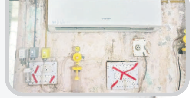
కొత్తగా ఏసీ అమర్చిన ఇప్పటికే ఇప్పటికే స్పెషల్ బోర్డులకు షార్ట్ సర్క్యూట్ వేసిన దృశ్యం