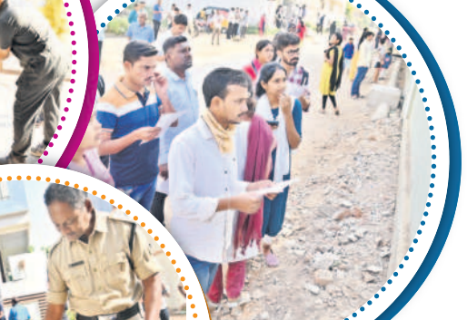
మంచెర్లాలలో పోలీస్ టికెట్ నంబర్లు చూసుకుంటున్న అభ్యర్థులు