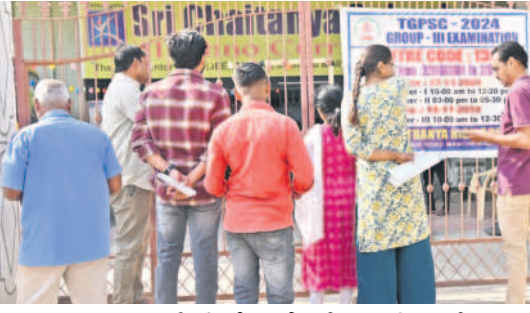
మంచెర్లాలలో పరీక్ష కేంద్రం గేటు వేయడంతో బయటి ఉన్న అభ్యర్థులు