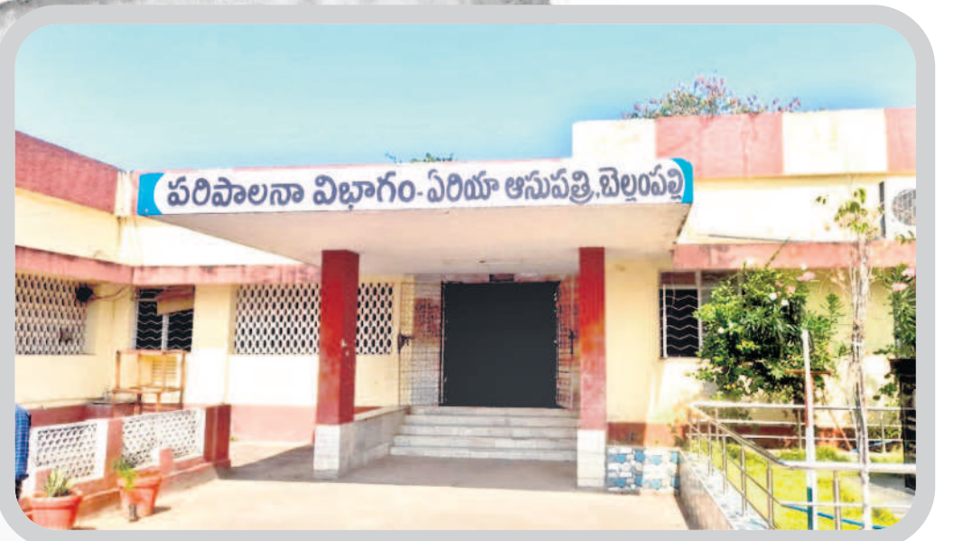
బెల్లంపల్లి సింగరేణి ఏరియా దవాఖాన