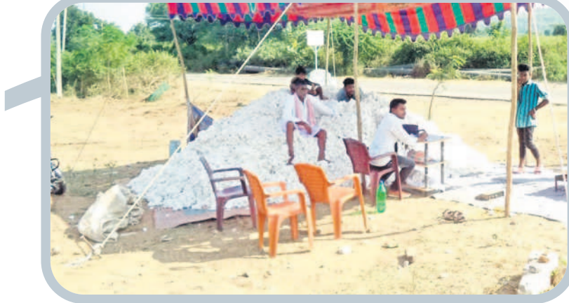
రోడ్డు పక్కనే పత్తి కొనుగోళ్లు చేస్తున్న వ్యాపారులు