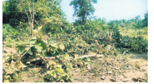
చెట్ల నరికివేసిన ప్రాంతం

దండేపల్లి, నవంబర్ 17 : మండలంలోని లింగాపూర్ బీట్లోని 380 కంపార్ట్మెంట్ లో కొందరు గుర్తుతెలియని వ్యక్తులు 100 చెట్లు, పొదలను నరికారు. ఆదివారం ఉదయం 20 మంది చెట్లు నరుకుతున్నారని సమాచారం అందడంతో అటవీ అధికారులు అక్కడికి వెళ్లి చూడగా, అప్పటికే వారు పారిపోయారు. ఈ విషయమై తాళ్ళపేట రేంజర్ సుపార్వారావును వివరణ కోరగా.. లింగాపూర్ బీట్లో చెట్ల పొదలు నరికితే మాట వాస్తవమేనన్నారు. ఈ విషయమై బీట్ సమీపంలోని దమ్మపల్లె, మామిడిగూడెం వాసులకు కొన్ని లింగ్ ఇచ్చి అవగాహన కల్పిస్తున్నారని. కాగా, పోడు కోసమే చెట్లు నరికివేసినట్లు తెలుస్తున్నది.