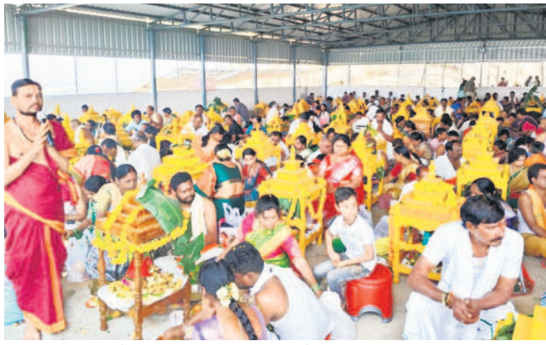
సామాహిక సత్యనారాయణస్వామి వ్రతాలు ఆచరిస్తున్న భక్తులు