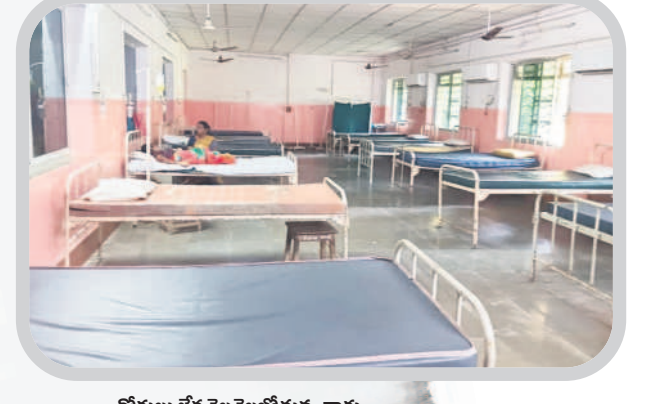
రోగులు లేక వెలవెలబోతున్న వార్డు

సింగరేణి ఏరియా దవాఖాన పరిరక్షణ కమిటీ ఆధ్వర్యంలో దవాఖానను రక్షిం