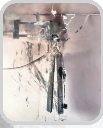
షార్ట్ సర్క్యూట్లో కాలిపోయిన ఏసీ