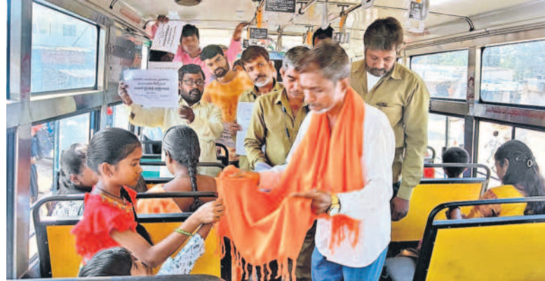
జవహర్ నగర్ లో ఆదివారం తెలంగాణ స్టేట్ బింబింగ్, బిబిటింగ్ జేపీసీ ఆధ్వర్యంలో ఆటో డ్రైవర్ల అర్జీని బస్సులో బిజ్జాటన చేసి... బస్సుల్లోగా నిరసన తెలిపారు. -జవహర్ నగర్, నవంబర్ 17