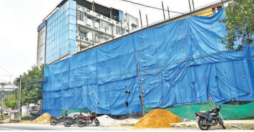
సిటీబ్యూరో, నవంబర్ 17 (నమస్తే తెలంగాణ) :