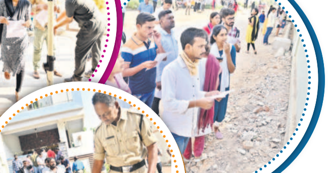
మంచెర్లాలలో పోలీస్ టికెట్ నంబర్లు చూసుకుంటున్న అభ్యర్థులు