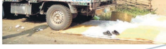
గ్రామాల్లో రైతుల ఇళ్ల వద్ద పత్తి కొనుగోళ్లు చేస్తున్న వ్యాపారులు

జిల్లాలోని సీసీవ కొనుగోళ్లు కేంద్రాలు లేని ఏజెన్సీ మండలాల్లో లింగాపూర్, సిర్పూర్-యూ, కెరవెరి, తిర్వణిలో దళారులు నేరుగా రైతుల నుంచి పత్తి కొనుగోళ్లు సాగుస్తున్నాయి. జిన్సింగ్ లో కొనుగోళ్లు పూర్తిస్థాయిలో గానే ఆలస్యం చేస్తున్నట్లు ఆరోపణలు ఉన్నాయి.