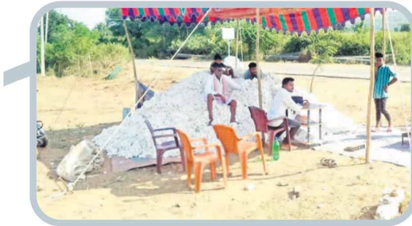
రోడ్డు పక్కనే పత్తి కొనుగోళ్లు చేస్తున్న వ్యాపారులు