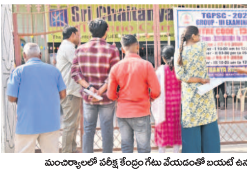
మంచెర్లాలలో పరీక్ష కేంద్రం గేటు వేయడంతో బయటి ఉన్న అభ్యర్థులు