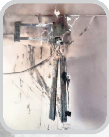
షార్ట్ సర్క్యూట్లో కాలిపోయిన ఏసీ