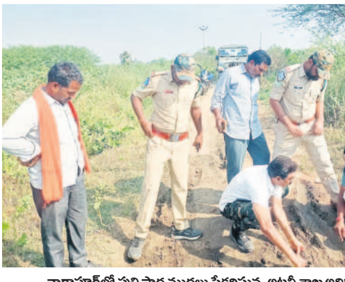
నాగపూర్లో పులి పాద ముద్రలు సేకరిస్తున్న అటవీ శాఖ అధికారులు