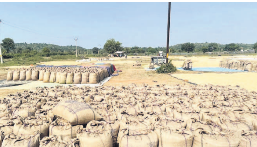
న్యూలోలం కొనుగోలు కేంద్రంలో తూకం వేసి లాబీ కోసం ఉంచిన ధాన్యం బస్తాలు