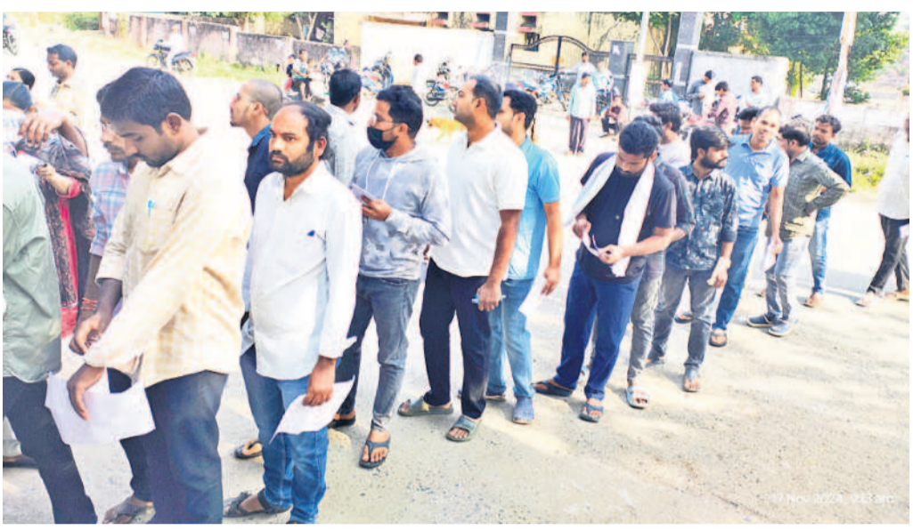
ఆదిలాబాద్ పరీక్ష కేంద్ర వద్ద క్యూలో నిల్వన్న అభ్యర్థులు

నికి డబ్బు, మద్యం ఇతర సామగ్రి చేరవేయడానికి చెక్ పోస్టుల ద్వారా వివిధ శాఖల సమన్వయంతో సమర్థవంతంగా నియంత్రించాలన్నారు. మహారాష్ట్ర నుంచి తెలంగాణ రాష్ట్రంలోకి ప్రవేశించే ప్రతి వాహనాన్ని క్షణంగా పరిశీలించాలని ఆదేశించారు. వాహనాల తనిఖీల సమయంలో వీడియో గ్రఫీ తీసుకోవాలన్నారు. సరిహద్దుల వద్ద ఉన్న చెక్ పోస్టులలో విధులు నిర్వహించే సిబ్బందికి అవసరమైన సదుపాయాల గురించి పోలీసు అధికారులకు పలు సూచనలు చేశారు. ఇందులో ఎస్ఐ శ్రీకాంత్ పాల్గొన్నారు.