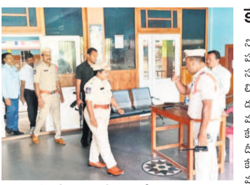
పరీక్షా కేంద్రాలను పరిశీలిస్తున్న ఎస్సీ జానకి పర్వల

నిర్మల్ ఛైన్ గేట్, నవంబర్ 17 : టీజీపీఎస్సీ గ్రూప్-3 పరీక్షలను పక్కాగా నిర్వహించాలని కలెక్టర్ అధిష్టా ఆదేశనం అధికారులకు అందేసారు. ఆదివారం నిర్మల్ పట్టణంలోని చాణ్డూ, సియిఎల్ ధామన్ పాఠశాలలో ఏర్పాటు చేసిన గ్రూప్-3 పరీక్షా కేంద్రాలను