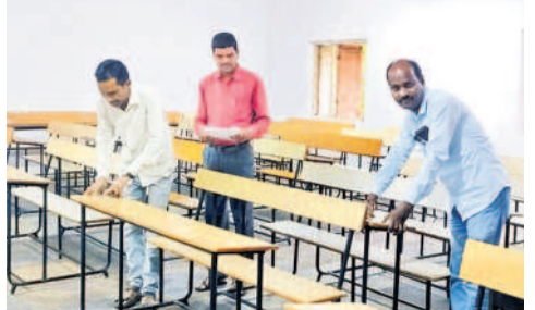
నల్లగొండ డి.వీ.ఎం కాలేజీలో ఏర్పాట్లు చేస్తున్న సిబ్బంది

రామగిరి/ సూర్యాపేట, నవంబర్ 16 : తెలంగాణ రాష్ట్ర పబ్లిక్ సర్వీస్ కమిషన్ ఆధ్వర్యంలో ఆది, సోమవారాల్లో నిర్వహించే గ్రూమ్ -3 పరీక్ష జిల్లా యంత్రాంగం సర్పంచ్ సిద్ధం చేసింది. పరీక్షల నిర్వహణ కోసం నల్లగొండ, సూర్యాపేట జిల్లాల్లో 133 కేంద్రాలను ఏర్పాటు చేయగా.. 44,896 మంది అభ్యర్థులు హాజరు కానున్నారు. అభ్యర్థులు పరీక్షకు నిర్దిష్ట సమయానికి గంట ముందుగానే చేరుకోవాల్సి ఉంటుంది. ప్రతి అభ్యర్థికి బయోమెట్రిక్ హాజరు నమోదు చేస్తున్నారు. పటిష్ట భద్రత మధ్య ప్రశాంత వాతావరణంలో పరీక్షలు రానే విధంగా చర్యలు తీసుకున్నారు. అభ్యర్థులకు ఇబ్బందులు కలుగకుండా అవసరమైన మౌలిక వసతులు కల్పించారు. అన్ని కేంద్రాల్లో విద్యుత్, తాగునీరు, ఫ్యాన్లు, మరుగుదొడ్లు అందుబాటులో ఉండేలా చర్యలు తీసుకున్నారు. పరీక్ష కేంద్రంలో అధికారులు, సిబ్బంది విధిగా బడి కార్యులు ధరించాల్సి ఉంటుంది. పరీక్ష మెటీరియల్స్ తరలింపును ప్రత్యేక బృందాలను ఏర్పాటు చేశారు.