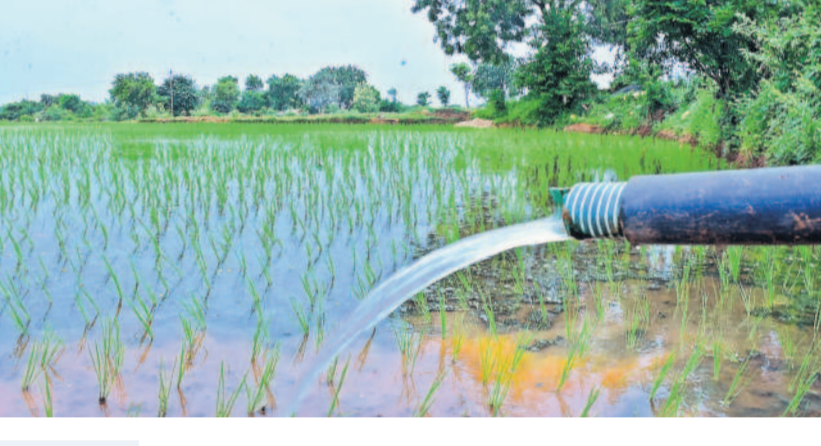
గత యాసంగిలో నీళ్లు లేక పంటలు ఆగం

యాదాద్రి భువనగిరి జిల్లాలో కొన్నేండ్లగా భూగర్భ జలాలు పుష్కలంగా ఉన్నాయి. ఏటా గంగమ్మ పైకి ఉబికివచ్చేది. నాలుగు నుంచి ఐదు మీటర్ల దూరంలోనే నీటిమట్టం ఉండేది. ఇందుకు బీఆర్ఎస్ ప్రభుత్వంలో చేపట్టిన అనేక కార్యక్రమాలు దోహదం చేశాయి. కానీ.. ఈ ఏడాది వివిధ కారణాలతో భూగర్భజలాలు ఇంకొకటి తగ్గుతున్నాయి. ఈ ఏడాది వానలు అకస్మాత్తుగా కురిశాయి. జిల్లాలో ఈ ఏడాది అక్టోబర్ వరకు సగటున 8 మీటర్ల లోతులో నీళ్లు న్నాయి. గతేడాది ఇదే నెలలో కేవలం 5 మీటర్లలో నీళ్లు ఉన్నాయి. అంటే ఇప్పుడు 3 మీటర్ల మేర నీళ్లు తగ్గిపోయాయి.