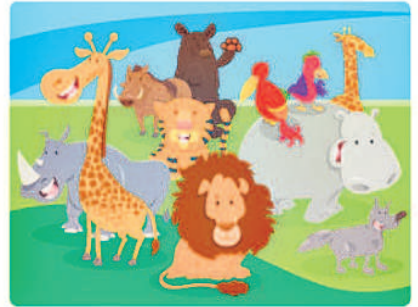
ఒకేలా కనిపిస్తున్న ఈ రెండు చిత్రాల్లో 6 తేదాలున్నాయి. అవేంటో కనిపెట్టండి.

పక్కాల్నే ఓ లచ్చాదికారి సచ్చిపోయిండు. సావుకు మన తిక్క శంకరయ్య గూడ వోయిండు. అక్కడ అందరు ఏడుతాంటి.. ఈనె గూడ ఎక్కెక్కీ ఏడ్వవట్టిండు. ఈనె ఏడ్పు సూశినోల్లంతా.. అపుకోలేక ఎక్కెక్కీ ఏడ్వ వట్టిండ్లు. సచ్చిమెయిం లచ్చాదికారి సోపతాయిని మన తిక్క శంకరయ్యను జూశి.. 'ఈడు నాకంటి ఎక్క సోపతా!?' అనుకొని.. 'ఇంతగనం ఏడుత్తున్నవు? నీకు మావోడు అంత ఎక్కనా!?' అంటు అడిగిండు. దానికి తిక్క శంకరయ్య.. 'నాకు ఆయిని ఎక్కంటి నేనేందుకు ఏడుత్త! ఎక్కలేదనే గింత తండ్లాట! ఎక్కంటి.. ఇల్లునామాల నాకింత భూమిజాగ రాసిత్తుండె గదా! గండుకనే ఏడుత్తున్న!' అంటు మొత్తుకున్నడు. అందరు తెల్లమొ కమేసి సూడవట్టిండ్లు. మనోడు మొత్తుకున్నడైతే ఆపుతలేడు.