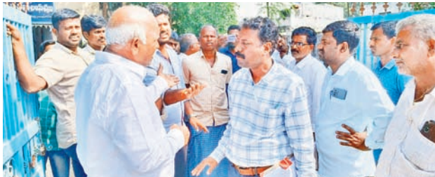
విచారణ అధికారితో మాట్లాడుతున్న కన్వెన్షన్ గ్రామస్థులు

మరికల్, నవంబర్ 16 : మండలంలోని కన్వెన్షన్లో ఉపాధి హామీ పనుల్లో చోటుచేసుకున్న ఆరోపణతో అధికారులు శనివారం విచారణ చేపట్టారు. అయితే విచారణ ఫిర్యాదులను అధికారులు నిరాకరించడంతో కొంతసేపు వాగ్వాదం చోటుచేసుకుంది. అనంతరం అధికారులు ఫిర్యాదులకు నచ్చజెప్పడంతో గ్రామస్థులు శాంతించారు. మరకల్ మండలంలోని కన్వెన్షన్లో ఉపాధి హామీ పనుల్లో చోటుచేసుకున్న ఆరోపణతో అధికారులు శనివారం విచారణ చేపట్టారు. అయితే విచారణ ఫిర్యాదులను అధికారులు నిరాకరించడంతో కొంతసేపు వాగ్వాదం చోటుచేసుకుంది. అనంతరం అధికారులు ఫిర్యాదులకు నచ్చజెప్పడంతో గ్రామస్థులు శాంతించారు.