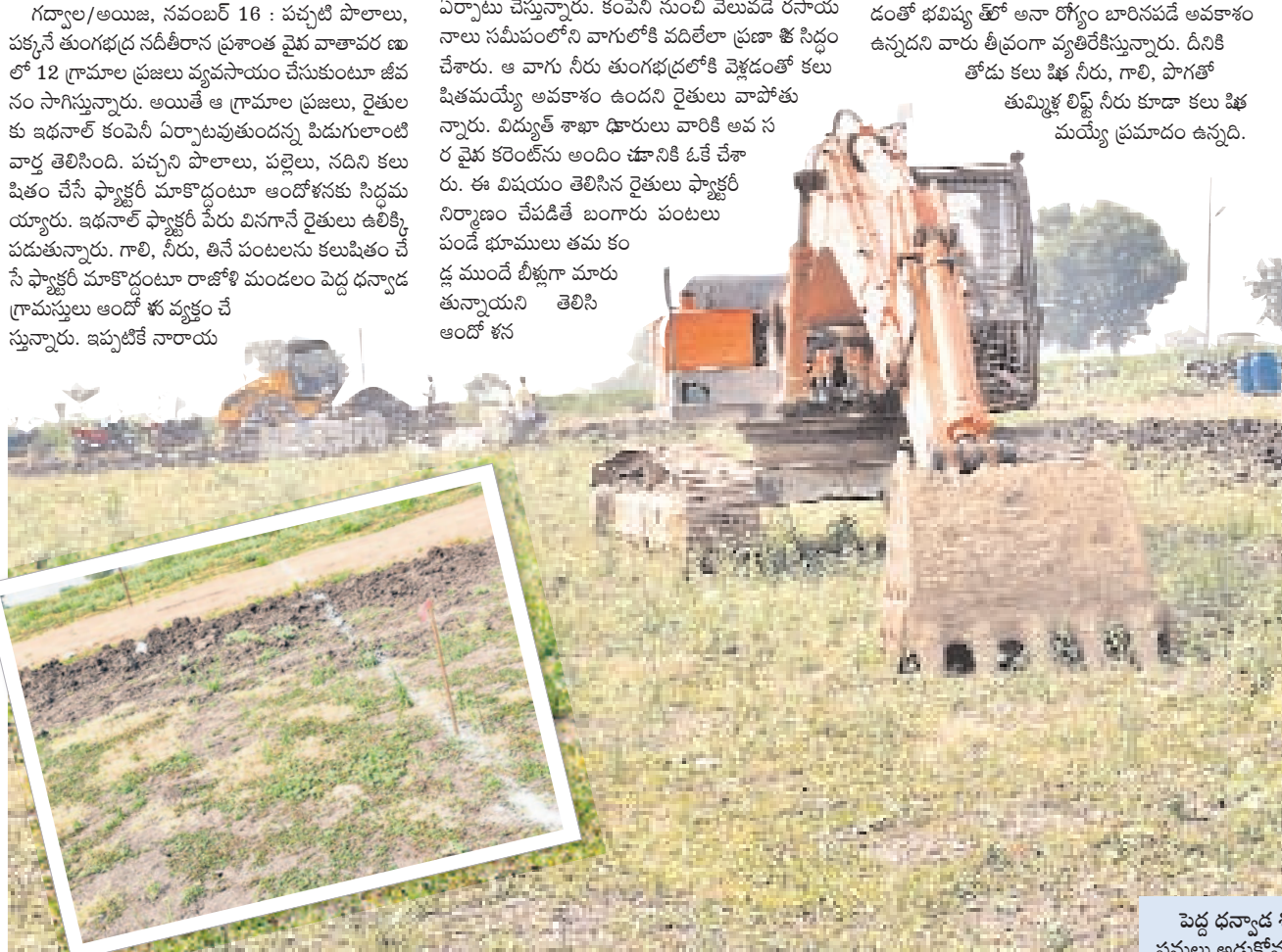
పెద్ద ధన్వాడ శివారులో ఇథనాల్ ఫ్యాక్టరీ నిర్మాణ స్థలంలో వెలిసిన గుడిసెలు, పనులు అడ్డుకోవడంతో నిలిచిన వాహనాలు, (ఇన్సెట్) నిర్మాణానికి వెళ్లిన ముగ్గురు

కేసీఆర్ ప్రభుత్వం పెద్దధన్వాడలోని నిరుపేద దళితులకు 152 ఎకరాల కేటాయింపును ముందుగానే పాటించాలని కోరారు. ఇక్కడ ప్రస్తుతం పొగాకు, మిరప, వేరుశనగ, కంది సాగు చేసే కొన్ని జీవిస్తున్నారు. వీరి పొలాల పక్కనే ఇథనాల్ ఫ్యాక్టరీ ఏర్పాటు కావడంతో భూములు సాగు చేసే కొన్ని జీవించే దళితులకు అన్యాయం జరిగి అవకాశం ఉంది. వారికి వ్యవసాయ భూమి లేక అర్థికంగా ఇబ్బందులు పడే అవకాశం ఉందని వాపో తప్పారు. 2009లో తుంగభద్ర నదికి వరదలు వచ్చిన సమయంలో ప్రభుత్వం ప్రస్తుతం ఫ్యాక్టరీ నిర్మాణం చేసే పొలం పక్కనే దళితులకు ఇండ్లు నిర్మించడం దుర్మార్గులకు భూమిని నాటి సర్కారు కేటాయింపు. సమీపంలోని కంపెనీ ఏర్పాటుపడుతుండడంతో భవిష్యత్లో అనారోగ్యం బారినపడే అవకాశం ఉన్నదని వారు తీవ్రంగా వ్యతిరేకిస్తున్నారు. దీనికి తోడు కలుషిత నీరు, గాలి, పొగతో తుమ్మిళ్ల లిప్టే నీరు కూడా కలుషితమయ్యే ప్రమాదం ఉన్నది.