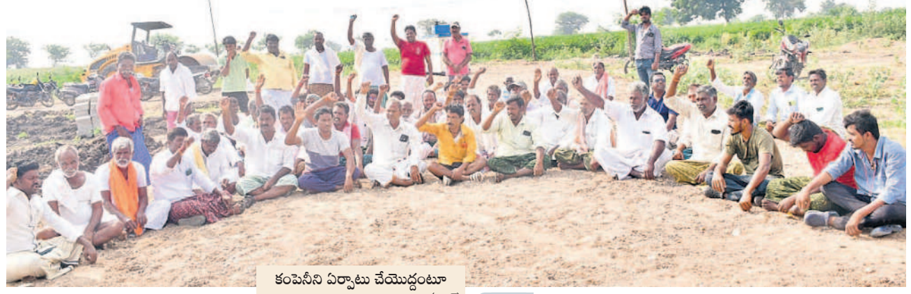
కంపెనీ ఏర్పాటు చేయడంపై నిరసన తెలుపుతున్న స్థానికులు (ఫైల్)

ఇథనాల్ పరిశ్రమ మార్కెట్.. ఇథనాల్ ఫ్యాక్టరీ నుంచి వచ్చే వ్యర్థాల వల్ల పచ్చని పంటలు పండి మా భూములు బీడుగా మారే అవకాశం ఉన్నది. బిత్తనూర్, నిర్మల్ జిల్లా గుండలపల్లి, దిలావర్పూర్ రైతులు వ్యతిరేకించారు. అనారోగ్య సమస్యలతో పాటు పంట పొలాలూ నాశనమవుతోంది. ఫ్యాక్టరీ సమీపంలో మూడు 20 ఎకరాల పొలం మూడి. ఫ్యాక్టరీ ఏర్పాటు చేసిన మొదటి రోజు నుంచి పంటలు నాశనమవుతున్నాయి. ఇథనాల్ పరిశ్రమ మార్కెట్.. ఇథనాల్ ఫ్యాక్టరీ నుంచి వచ్చే వ్యర్థాల వల్ల పచ్చని పంటలు పండి మా భూములు బీడుగా మారే అవకాశం ఉన్నది. బిత్తనూర్, నిర్మల్ జిల్లా గుండలపల్లి, దిలావర్పూర్ రైతులు వ్యతిరేకించారు. అనారోగ్య సమస్యలతో పాటు పంట పొలాలూ నాశనమవుతున్నాయి. ఇథనాల్ పరిశ్రమ మార్కెట్.. ఇథనాల్ ఫ్యాక్టరీ నుంచి వచ్చే వ్యర్థాల వల్ల పచ్చని పంటలు పండి మా భూములు బీడుగా మారే అవకాశం ఉన్నది. బిత్తనూర్, నిర్మల్ జిల్లా గుండలపల్లి, దిలావర్పూర్ రైతులు వ్యతిరేకించారు. అనారోగ్య సమస్యలతో పాటు పంట పొలాలూ నాశనమవుతున్నాయి.