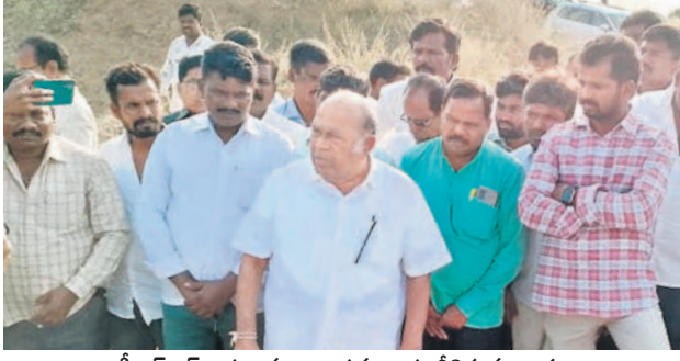
పీఆర్ఎల్ఐ ప్రధాన కార్యకర్తలను వెంటనే పూర్తి చేయాలని కోరారు.

కొల్లా పూర్తి, నవంబర్ 16 : కేసీఆర్ ప్రభుత్వం ప్రతిపక్షంగా ప్రారంభించిన పాలమూరు-రంగారెడ్డి ఎత్తిపోతల పథకం పనులు పూర్తి చేసి సాగునీరు పారించాలని మాజీ మంత్రి, బీఆర్ఎస్ నేత నాగం జనార్దన్ రెడ్డి డిమాండ్ చేశారు. పీఆర్ఎల్ఐ మాజీ ప్రాజెక్టులోని కుడికట్ట-తీర్మానంపై ముద్యం పెండింగ్ కింద ప్రధాన కార్యకర్తలను వెంటనే పూర్తి చేయాలని కోరారు. కేసీఆర్ ప్రధాన కార్యకర్తలను వెంటనే పూర్తి చేయాలని కోరారు. కేసీఆర్ ప్రధాన కార్యకర్తలను వెంటనే పూర్తి చేయాలని కోరారు.