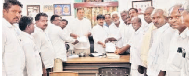
ఎమ్మెల్యే, ఎమ్మెల్యేకు వినతిపత్రం అందజేస్తున్న రాజోళి మండలం రైతులు

అలంపూర్ చౌరస్తా, నవంబర్ 16 : ఇథనాల్ కంపెనీ ఏర్పాటుతో మూ గ్రామాల్లో పంట పొలాలూ మారే అవకాశం ఉందని, ఈ ప్రాజెక్టు నిర్మాణం చేపడితే రైతులకు వలసలు తప్పవని ఎమ్మెల్యే చల్లా వెంకట్రామిరెడ్డి, ఎమ్మెల్యే విజయకుమార్ రాజోళి మండలానికి చెందిన రైతులు గోడు వెళ్ల గొర్రు. శనివారం రాజోళి మండలానికి చెందిన ప్రజలు ఇథనాల్ కంపెనీ ఏర్పాటుతో మూ గ్రామాల్లో పంట పొలాలూ మారే అవకాశం ఉందని, ఈ ప్రాజెక్టు నిర్మాణం చేపడితే రైతులకు వలసలు తప్పవని ఎమ్మెల్యే చల్లా వెంకట్రామిరెడ్డి, ఎమ్మెల్యే విజయకుమార్ రాజోళి మండలానికి చెందిన రైతులు గోడు వెళ్ల గొర్రు.