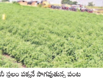
కంపెనీ స్థలం పక్కనే సాగుతున్న పంట

చెందుకున్నారు. మాకూ.. మా గ్రామాలకు, పంటలకు హాని కలిగించే పరిశ్రమ నిర్మించడం టూ ఆందోళనకరం అన్నారు.