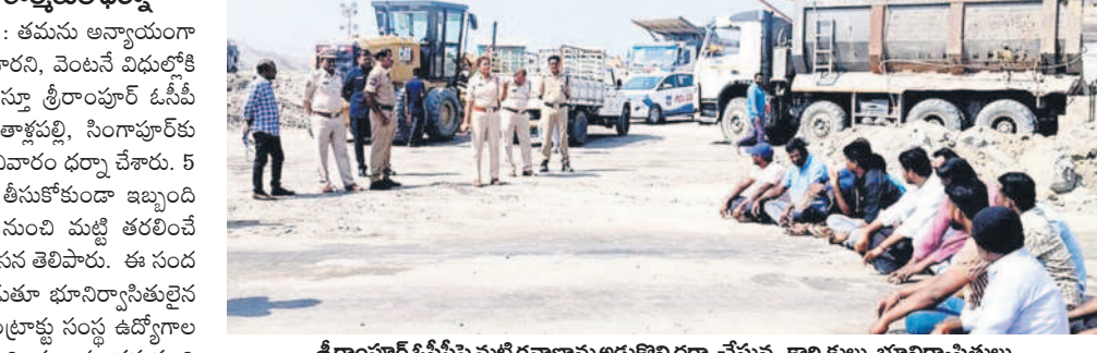
శ్రీరాంపూర్ ఓసీపీపై మట్టి వేధిస్తున్నారని ఆరోపించారు. భూనిర్వాహక కమిషనర్ నుంచి సీఆర్ఆర్ కాంట్రాక్టు సంస్థ ఉద్యోగాల నుంచి అకారణంగా తొలగించినట్లు తెలిపారు. తమను విడుదల తీసుకోవాలని 5 నెలలుగా జీఎం ఆఫీస్, స్టాండ్ క ఎమ్మెల్యే చుట్టూ తిరిగి విన్నవించుకున్నా పట్టించుకోవడం లేదని ఆవేదన వ్యక్తం చేశారు. శ్రీరాంపూర్ ఓసీపీకి తమ భూమిలిచ్చామని, ఆ నడుమంలో స్థానికులతో 80 శాతం కాంట్రాక్టు ఉద్యోగాలు ఇస్తామని చెప్పి ఇతర ప్రాంతాల వారిని నియమించారని చెప్పారు. తమను ఉద్యోగాల నుంచి తొలగించడంపై ప్రతిస్పందించారు.

శ్రీరాంపూర్, నవంబర్ 16 : తమను అన్యాయంగా ఉద్యోగాల నుంచి తొలగించారని, వెంటనే విడుదలకొని తీసుకోవాలని డిమాండ్ చేస్తూ శ్రీరాంపూర్ ఓసీపీ భూనిర్వాహక కమిషనర్ గ్రామాలైన తాళ్లపల్లి, సింగపూర్ కు చెందిన ఓసీపీ కార్మికులు శనివారం ధర్మా చేశారు. 5 నెలలుగా తమను విడుదల తీసుకోకుండా ఇబ్బంది పెడుతున్నారంటూ ఓసీపీ నుంచి మట్టి తరలింపే వాహనాలను ఆడ్డోగోల నిరసన తెలిపారు. ఈ సందర్భంగా కార్మికులు మాట్లాడుతూ భూనిర్వాహక కమిషనర్ నుంచి సీఆర్ఆర్ కాంట్రాక్టు సంస్థ ఉద్యోగాల నుంచి అకారణంగా తొలగించినట్లు తెలిపారు. తమను విడుదల తీసుకోవాలని 5 నెలలుగా జీఎం ఆఫీస్, స్టాండ్ క ఎమ్మెల్యే చుట్టూ తిరిగి విన్నవించుకున్నా పట్టించుకోవడం లేదని ఆవేదన వ్యక్తం చేశారు. శ్రీరాంపూర్ ఓసీపీకి తమ భూమిలిచ్చామని, ఆ నడుమంలో స్థానికులతో 80 శాతం కాంట్రాక్టు ఉద్యోగాలు ఇస్తామని చెప్పి ఇతర ప్రాంతాల వారిని నియమించారని చెప్పారు. తమను ఉద్యోగాల నుంచి తొలగించడంపై ప్రతిస్పందించారు.