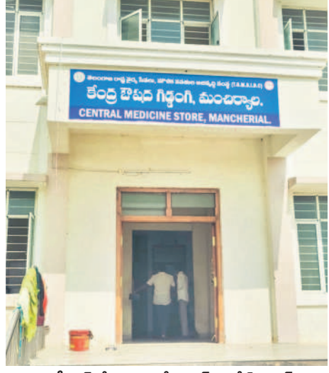
ఎంసీహెచ్లో ఏర్పాటు చేసిన డ్రగ్ కంట్రోల్ సెంటర్

మంచిర్యాల అర్బన్, నవంబర్ 16 : మంచిర్యాల జిల్లా కేంద్రంలోని ఎంసీహెచ్ (మాతా శిశు ఆరోగ్య సంరక్షణ కేంద్రం)లోనే ఔషధ గిడ్డంగి (సీడీఎస్) సెంటర్ ప్రారంభమైంది. గతంలో మంచిర్యాల ప్రభుత్వ దవాఖానలకు మందులు కావాలంటే ఆదిలాబాద్ సెంట్రల్ డ్రగ్ స్టోర్ నుంచి తీసుకురావాల్సింది. అక్కడి నుంచి తీసుకురావాలంటే తరచూ తీవ్ర ఇబ్బందులు ఎదురవుతున్నాయి. జాతీయ వైద్య మిషన్ పథకంలో భాగంగా ఎంసీహెచ్లో నాలుగు ప్రత్యేక గదుల్లో సీడీఎస్ ను ఏర్పాటు చేసి అధికారులు సేవలను ప్రారంభించారు. దీంతో ఔషధాలకు ఇక ఇబ్బందులు తొలగిపోయిన వైద్యాధికారులు చెబుతున్నారు. ఈ కేంద్రానికి అవసరమైన మందులను హైదరాబాద్ సీడీఎస్ తో పాటు ఇతర కంపెనీల నుంచి నేరుగా సరఫరా కానున్నాయి. ఇప్పటి వరకు 70కి పైగా రకాల మందులు డ్రగ్ సెంటర్ కు వచ్చాయని, రోజు కొన్ని కొన్ని వస్తున్నట్లు, మరిన్ని రావాల్సి ఉంది.