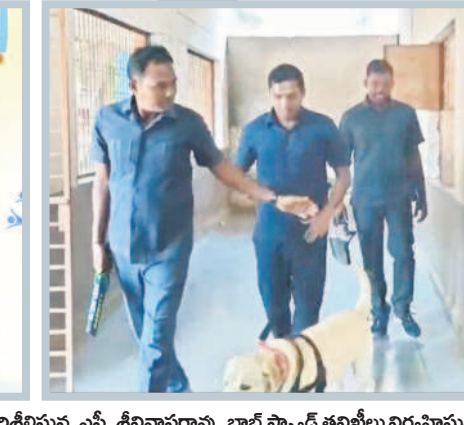
గరుకులంలో ఏర్పాటు చేసిన పర్యవేక్షిస్తున్న అధికారులు