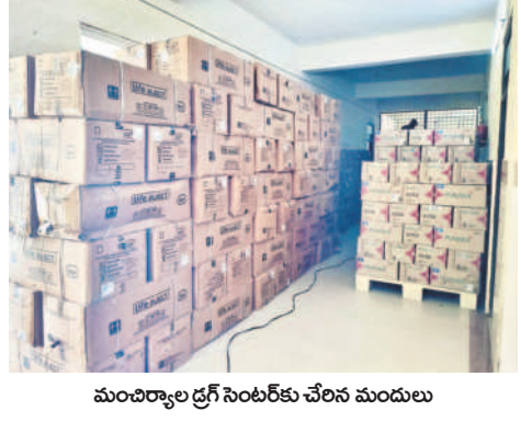
మంచిర్యాల డ్రగ్ సెంటర్ కు చేరిన మందులు

ఎంసీహెచ్లో ఏర్పాటు చేసిన డ్రగ్ సెంటర్లో ఆరుగురు సిబ్బంది అవసరం ఉంటుంది. ప్రస్తుతం పార్సీ సూపర్ వైజర్, ఫార్మసీస్ట్ మాత్రమే ఉన్నారు. డాటా ఎంట్రీ ఆఫీసర్, ఇద్దరు ప్యాకర్లు, వాచ్మెన్, మందుల రవాణా కోసం ప్రత్యేక వాహనాలను కూర్చో ఉంది. ప్రస్తుతానికి ఒక హైయర్ వెహికల్లో మందులను సరఫరా చేస్తున్నారు. సీడీఎస్ ఏర్పాటు పనులు ఇంకా జరుగుతున్నాయి.