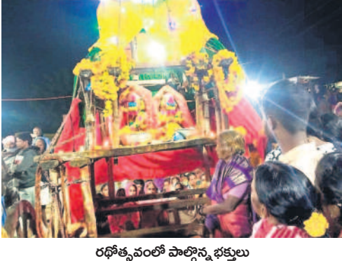
రథోత్సవంలో పాల్గొన్న భక్తులు

కోటపల్లి, నవంబర్ 16 : కోటపల్లి మండలం జనగామ గ్రామంలో మదనపోచమ్మ జాతర వైభవంగా కొనసాగుతున్నది. కోటపల్లి మండలంలో పాటు చుట్టూ పక్కల మండలాలతో పాటు మహారాష్ట్ర నుంచి భక్తులు తరలివచ్చి ప్రత్యేక పూజలు చేసి మొక్కులు తీర్చుకున్నారు. జాతరకు పెద్ద సంఖ్యలో భక్తులు హాజరు కాగా నందడి పండుగ వాతావరణం ఏర్పడింది. అమ్మవార్ల రథోత్సవంలో పెద్ద సంఖ్యలో భక్తులు పాల్గొన్నారు.