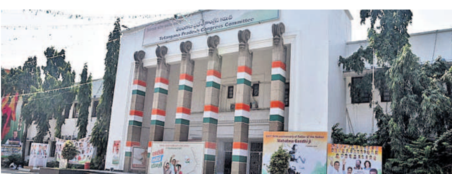
అప్పుడు వాళ్లే... ఇప్పుడు వాళ్లేనా అంటూ ఆలోచించుకుంటున్న నియోజకవర్గంలోని రాజకీయాలకు ప్రస్తుతం దిక్కుతోచని పరిస్థితులు వెలకొన్నాయని చెప్పారు.