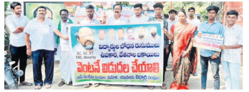
అర్టీవో కార్యాలయం ఎదుట నిరసన తెలుపుతున్న టీసీ సంక్షేమ సంఘం నాయకులు