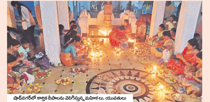
షాద్ నగర్ లో కార్మిక దీపావత్సవం మహిళలు, యువతులు