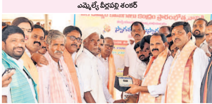
అమ్మల్నే వీధిపల్లి శంకర్

షాద్ నగర్, నవంబరు 15: రైతులు ధాన్యానికి విక్రయించేందుకు నాణ్యత ప్రమాణాలను పాటించి ప్రభుత్వ మద్దతు ధరను పొందాలని అమ్మల్నే వీధిపల్లి శంకర్ రైతులకు సూచించారు. శుక్రవారం శేకంపేటలో కొత్త పంట పీచిపిఎస్ ఆధ్వర్యంలో పద్ద కొనుగోలు కేంద్రాన్ని ప్రారంభించిన అనంతరం మాట్లాడారు. గ్రామాల రైతులు దళారులను ఆశ్రయించి తక్కువ ధరకు తమ పంటను అమ్ముకోవడం సూచించారు. ఈ యేడు సన్న పద్దకు అదనంగా రూ. 500 బోనస్ ప్రభుత్వం చెల్లిస్తున్న విషయాన్ని రైతులు గ్రహించాలని చెప్పారు. త్వరలోనే రైతు భరోసా నిధులు రైతుల ఖాతాల్లో జమపూతాయనారు. రైతుల సమస్యలపై సంబంధిత శాఖ అధికారులు స్పందించాలని సూచించారు. కార్యక్రమంలో మండల అధికారులు, ఆ పార్టీ నాయకులు పాల్గొన్నారు.