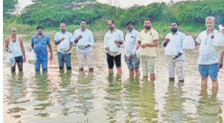
వెలిజర్లలో ఉచిత చేప పిల్లల పంపిణీ

షాద్ నగర్ రూరల్, నవంబరు 15 : అన్ని వర్గాల ఆర్థిక అభివృద్ధికి కొంగ్రెస్ ప్రభుత్వం కృషి చేస్తుందని వెలిజర్ల కొంగ్రెస్ నాయకులు అన్నారు. శుక్రవారం ప్రభుత్వం అందించిన ఉచిత చేప పిల్లలను గ్రామ చెరువులో వదిలారు. ఈ సందర్భంగా నాయకులు మాట్లాడుతూ.. ఉచిత చేపలను పంపిణీ చేసినందుకు ప్రభుత్వానికి కృతజ్ఞతలు తెలిపారు.