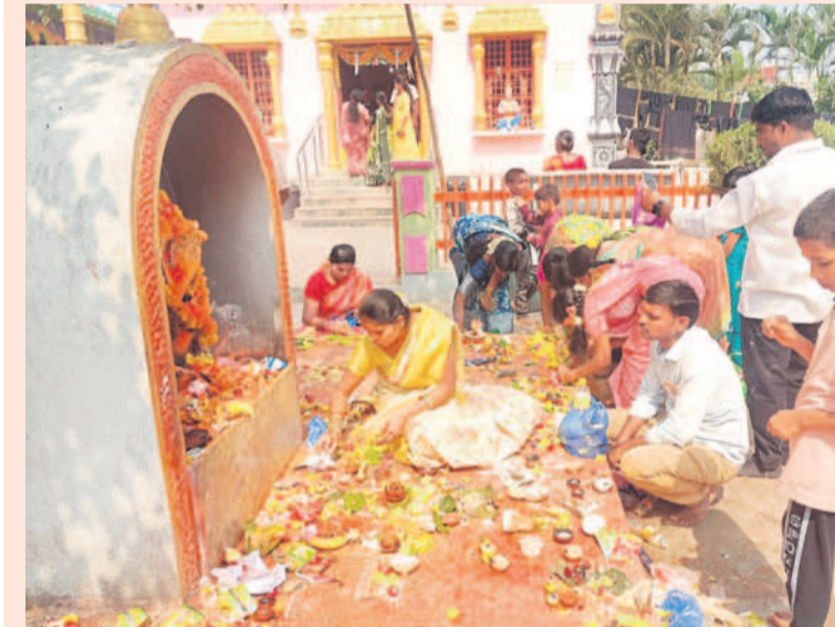
మొయినాబాద్ లోని కనకమామిడిలోని సంఘమేకర్త ఆలయంలో కార్మిక దీపావత్సవం