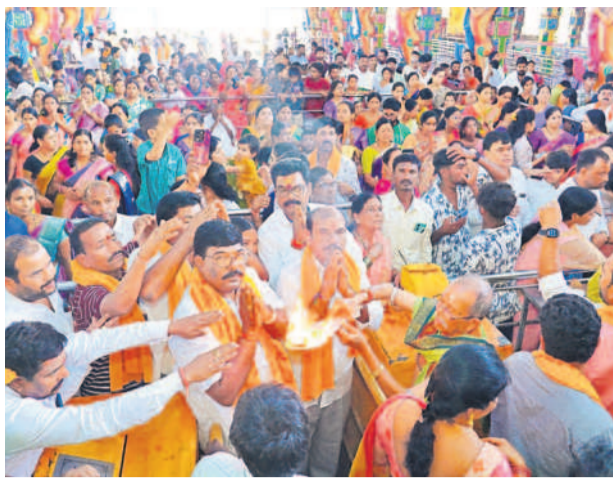
హరతి తీసుకుంటున్న భక్తులు

షాద్ నగర్, నవంబరు 15: రైతులు ధాన్యానికి విక్రయించేందుకు నాణ్యత ప్రమాణాలను పాటించి ప్రభుత్వ మద్దతు ధరను పొందాలని అమ్మల్నే వీధిపల్లి శంకర్ రైతులకు సూచించారు. శుక్రవారం శేకంపేటలో కొత్త పంట పీచిపిఎస్ ఆధ్వర్యంలో పద్ద కొనుగోలు కేంద్రాన్ని ప్రారంభించిన అనంతరం మాట్లాడారు. గ్రామాల రైతులు దళారులను ఆశ్రయించి తక్కువ ధరకు తమ పంటను అమ్ముకోవడం సూచించారు. ఈ యేడు సన్న పద్దకు అదనంగా రూ. 500 బోనస్ ప్రభుత్వం చెల్లిస్తున్న విషయాన్ని రైతులు గ్రహించాలని చెప్పారు. త్వరలోనే రైతు భరోసా నిధులు రైతుల ఖాతాల్లో జమపూతాయనారు. రైతుల సమస్యలపై సంబంధిత శాఖ అధికారులు స్పందించాలని సూచించారు. కార్యక్రమంలో మండల అధికారులు, ఆ పార్టీ నాయకులు పాల్గొన్నారు.