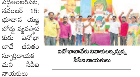
వినోభాబావకు నివాళులర్పిస్తున్న సీపీఐ నాయకులు