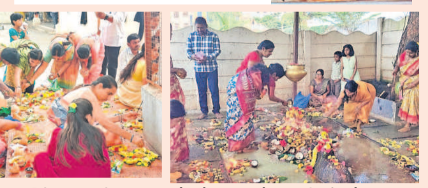
మొయినాబాద్ లోని శివాలయంలో..