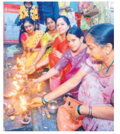
వేములవాడ టౌన్: రాజన్న ఆలయ ప్రాంగణంలో కార్తీకదీపాలు వెలిగిస్తున్న భక్తులు