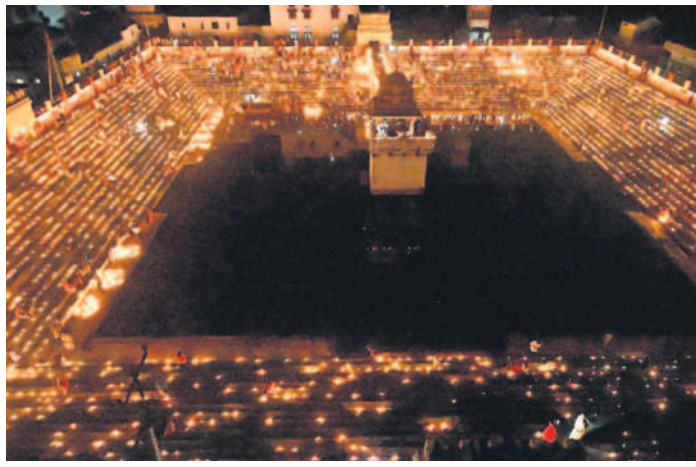
ధర్మపురి: విద్యుత్తీపాల అలంకరణలో కోనేరు