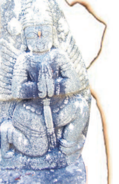
ప్రదర్శన క్షేత్రం కావాలంటున్న జనం

అరుదైన, ఘనమైన చారిత్రక వారసత్వాన్ని కలిగిన జిల్లా జగిత్యాల. గోదావరినది పరీవాహకంగా అధికంగా ఉండి, మానవ కోటి నాగరికత అభివృద్ధి మూలాలు కలిగిన నేల. తొలి రాతియుగం, మతి రాతియుగం ఆనవాళ్ళు, రాకాసి గుళ్ళు, పురాతన పునాదులు ఉన్న ప్రాంతం. దక్షిణ భారత దేశాలను సమైక్యం చేసే పరిపాలించిన శాతవాహనుల తొలి రాజధాని అయిన కోటి లింగాలకు అవాలంగా, అరుదైన కాకతీయుల త్రికుటాలయాలు, చాళుక్యుల నిర్మాణాలకు కేంద్రంగా, పాలవాస మేడరాజులు పాలించిన ఈ క్షేత్రంలో చారిత్రక సంపద నిర్లక్ష్యమై నీడలో ముగిస్తున్నది. అధికారులు, ప్రజాప్రతినిధుల పట్టించుకోలేక ఆరుబయటి ఎండకు ఎండకూ, వానకు తడిసిపోతున్నది. పురావస్తు అవశేషాలను నిర్లక్ష్యం చేయడంతో కాలగర్భంలో కలిసిపోగా, మరికొన్నింటిని కరీంనగర్, హైదరాబాద్ చారిత్రక, పురావస్తు ప్రదర్శన శాలలకు యంత్రాంగం తరలింది. అయితే జగిత్యాల జిల్లాగా ఏర్పడ్డ నేపథ్యంలో గతంలో ఇక్కడి నుంచి వివిధ ప్రదర్శన శాలలకు తీసుకెళ్లి అరుదైన వస్తువులు, నాణేలను తిరిగి తెప్పించాలని, జిల్లాలోని చారిత్రక సంపదను కాపాడాలని డిమాండ్ వినిపిస్తున్నది.