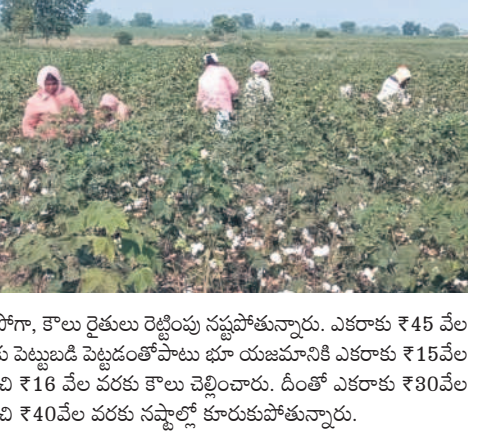
కోనరావుపేటలో పత్తిని తీస్తున్న కూలీలు