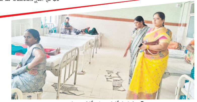
దవాఖానలోని ఓ వార్డులో పగిలిన బెడ్

ఖిలేవాడి, నవంబర్ 15 : నిజామాబాద్ జిల్లాకేంద్రంలో ఏడంతస్తుల్లో ఉన్న ప్రభుత్వ జనరల్ దవాఖాన వలయంగా మారింది. బయట నుంచి చూస్తే అద్దాల మేడగా కనిపిస్తున్నా.. లోప మాత్రం వసతుల లేమితో కొట్టుమిట్టాడుతున్నది. దీంతో రోగులతోపాటు వేషింట్లతో ఉండే వారు ఇబ్బందులు ఎదుర్కొంటున్నారు. కేసీఆర్ ప్రభుత్వ హయాంలో దవాఖానలో అన్ని వసతుల కల్పించడంతో పాటు కొట్ల రూపాయలతో పరికరాలు, ఖరీదైన వైద్యం, క్యాన్సర్లు, సీసీసీలు తదితర పరికరాలను అందుబాటులోకి తీసుకువచ్చి, నిరుపేదలకు అత్యాచారాలకు పరికరాలతో వైద్యసేవలను సులభతరం చేసింది. కాంగ్రెస్ ప్రభుత్వం అధికారంలోకి వచ్చిన ఏడాదిలోనే ప్రభుత్వ దవాఖాన పరిస్థితి అస్పష్టంగా మారింది. నిజామాబాద్ ప్రభుత్వ దవాఖాన అంటే వెళ్లింది పేరు. మహారాష్ట్ర ఆదిలాబాద్, నిర్మల్ నుంచి రోగులు వస్తుంటారు. రోజురోజుకూ దవాఖానకు వచ్చే రోగుల సంఖ్య పెరుగుతున్నప్పటికీ దవాఖానలో సరైన సౌకర్యాల సమకూర్చడం లేదు. దవాఖానలో విరిగిన బెడ్లు, వేషింట్లతో వచ్చిన వారు కూర్చుండేందుకు స్కూళ్ల లేక పోవడం, పలు గదుల్లో వాటర్ లీకేజీ, తాగేందుకు నీరు లేకపోవడం తదితర సమస్యలతో రోగులు, దవాఖానకు వచ్చే వారు ఇబ్బందులు ఎదుర్కొంటున్నారు.