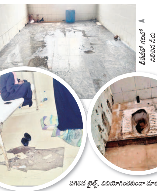
పగిలిన బెడ్లు, వినియోగించకుండా మారిన మరుగుదొడ్డి