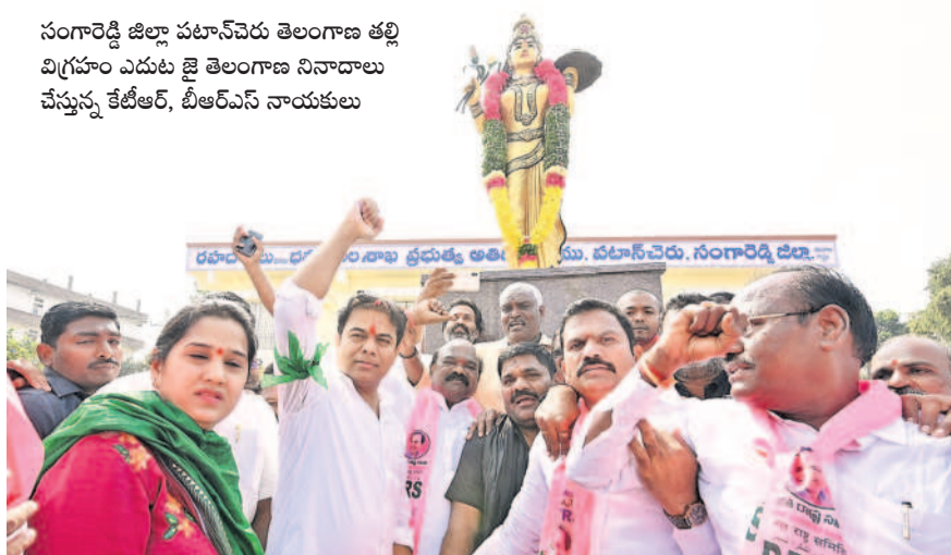
సంగారెడ్డి జిల్లా పటాన్చెరు తెలంగాణ తల్లి విగ్రహం ఎదుట జై తెలంగాణ నినాదాలు చేస్తున్న కేటీఆర్, బీఆర్ఎస్ నాయకులు