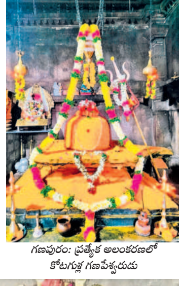
గణపరం: ప్రత్యేక అలంకారంలో కోటగుట్ట గణపేశ్వరుడు