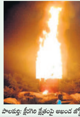
పాలకుర్తి: క్షీరగిరి క్షేత్రంపై అఖండ జ్యోతి