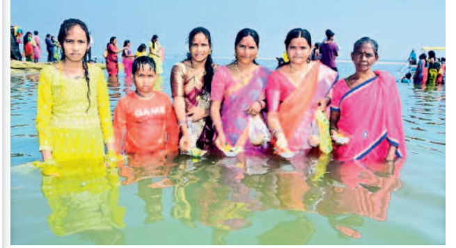
కాశ్యపరం: గోదావరిలో దీపాలను వదులుతున్న భక్తులు