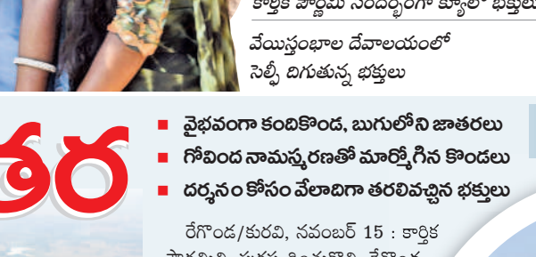
వేయిస్తంభాల దేవాలయంలో నెల్లీ దిగుతున్న భక్తులు

■ శివకేశవులకు ప్రత్యేక పూజలు, దీపాల వెలుగులు ■ కనులవండుమా జ్వాలాతోరణం, అఖండ జ్యోతి