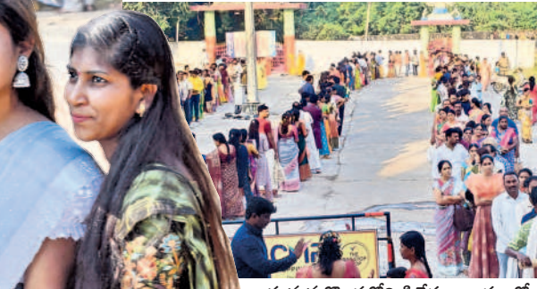
హనుమకొండలోని సిద్దేశ్వరాలయంలో కార్తిక పౌర్ణమి సందర్భంగా క్యూలో భక్తులు