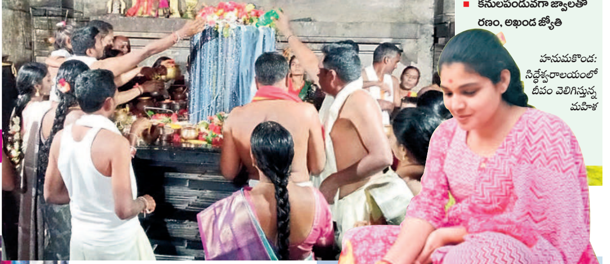
వెంకటాపూర్: శివలింగానికి అభిషేకాలు చేస్తున్న భక్తులు

కాశ్యపరం, నవంబర్ 15 : పవిత్ర కార్తిక పౌర్ణమి పర్వదినాన్ని శుభవరంగా జరుపుకొన్నారు. వేకువజామం నుంచే భక్తజనంతో ఆలయాలన్నీ పోటిత్తగా, సాయంత్రం వేళ ప్రముఖ క్షేత్రాలతో పాటు ఊరూరూరూ కార్తిక దీపాల వెలుగులతో శోభిల్చాయి. హనుమకొండలోని చారిత్రిక వేయిస్తంభాల రుద్రేశ్వరాలయం, భద్రకాళీ, ఐనవోలు మల్లికార్జునస్వామి ఆలయం, పాలకుర్తిలోని సోమేశ్వరాలయం, కాశ్యపరం-ముక్తేశ్వరాలయం సహా అన్ని ఆలయాలలో ఉదయం నుంచే దర్శనం కోసం బారులు తీరారు. రుద్రాభిషేకంతో పాటు ప్రత్యేక పూజలు నిర్వహించగా అంతటా సందడి కనిపించింది. ఈ సందర్భంగా ఊరి, తులసి చెట్ల వద్ద దీపాలు వెలిగించారు. అలాగే పలుచోట్ల రాత్రి వేళ లక్ష్మీ దీపాభిషేకం, జ్వాలాతోరణం, అఖండ జ్యోతి వెలిగించగా భక్తులు పెద్దసంఖ్యలో తరలివచ్చి దర్శనం చేశారు. అలా గే కాశ్యపరంలోని కాశ్యప-ముక్తేశ్వర స్వామి వారి ఆలయం పౌర్ణమి సందర్భంగా భక్తులతో పోటిత్తింది. ఉమ్మడి వరంగల్ నుంచే గాక ఇతర జిల్లాలు, రాష్ట్రాల నుంచి వచ్చిన వారితో త్రివేణి సంగమం పులకించింది. గోదావరి పుష్కరఫూల్ వద్ద భక్తులు పుణ్యస్నానాలు చేసి నదీమాతకు దీపాలు వదిలి, సైకత రింగాలను పూజించారు. కార్తిక మాసం పౌర్ణమి రోజున ఆలయానికి ఒకే రోజు రూ.9 లక్షల ఆదాయం సమకూరింది. ఉదయం 9 గంటలకు ఐదు కలశాల్లో నదీ జలాలు తీసుకొచ్చి స్వామి వారికి ప్రత్యేక అభిషేకాలు నిర్వహించగా, మధ్యాహ్నం 12 గంటలకు శివకల్యాణం జరిపించారు. అలాగే సత్యనారాయణ వ్రతాలతో పాటు ఆలయ ఆవరణలోని ఉసిరి, మారేడు చెట్లకు మహిళలు లక్ష వత్తులు, లక్ష ముగ్గులతో దీపాలంకరణ చేశారు. సాయంత్రం నడి మాతకు హారతి ఇచ్చారు.