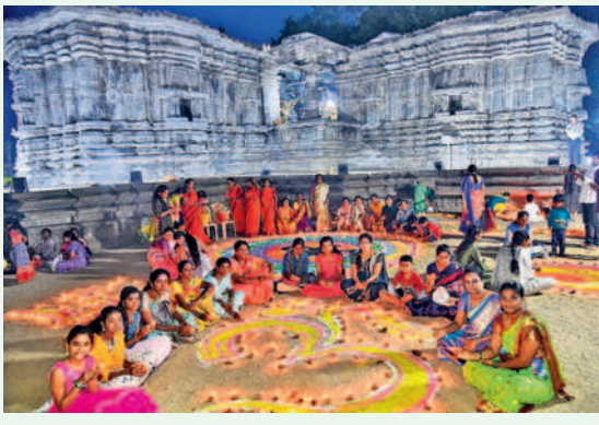
హనుమకొండలోని వేయిస్తంభాల దేవాలయంలో ముగ్గులు వేసి, ఓం ఆకారంలో దీపాలు వెలిగిస్తున్న భక్తులు