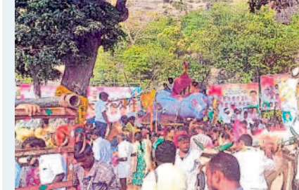
రేగొండ: జాతరలో ఎడ్ల బండ్ల ప్రదర్శనలు

కాశ్యపరం, నవంబర్ 15 : పవిత్ర కార్తిక పౌర్ణమి పర్వదినాన్ని శుభవరంగా జరుపుకొన్నారు. వేకువజామం నుంచే భక్తజనంతో ఆలయాలన్నీ పోటిత్తగా, సాయంత్రం వేళ ప్రముఖ క్షేత్రాలతో పాటు ఊరూరూరూ కార్తిక దీపాల వెలుగులతో శోభిల్చాయి. హనుమకొండలోని చారిత్రిక వేయిస్తంభాల రుద్రేశ్వరాలయం, భద్రకాళీ, ఐనవోలు మల్లికార్జునస్వామి ఆలయం, పాలకుర్తిలోని సోమేశ్వరాలయం, కాశ్యపరం-ముక్తేశ్వరాలయం సహా అన్ని ఆలయాలలో ఉదయం నుంచే దర్శనం కోసం బారులు తీరారు. రుద్రాభిషేకంతో పాటు ప్రత్యేక పూజలు నిర్వహించగా అంతటా సందడి కనిపించింది. ఈ సందర్భంగా ఊరి, తులసి చెట్ల వద్ద దీపాలు వెలిగించారు. అలాగే పలుచోట్ల రాత్రి వేళ లక్ష్మీ దీపాభిషేకం, జ్వాలాతోరణం, అఖండ జ్యోతి వెలిగించగా భక్తులు పెద్దసంఖ్యలో తరలివచ్చి దర్శనం చేశారు. అలా గే కాశ్యపరంలోని కాశ్యప-ముక్తేశ్వర స్వామి వారి ఆలయం పౌర్ణమి సందర్భంగా భక్తులతో పోటిత్తింది. ఉమ్మడి వరంగల్ నుంచే గాక ఇతర జిల్లాలు, రాష్ట్రాల నుంచి వచ్చిన వారితో త్రివేణి సంగమం పులకించింది. గోదావరి పుష్కరఫూల్ వద్ద భక్తులు పుణ్యస్నానాలు చేసి నదీమాతకు దీపాలు వదిలి, సైకత రింగాలను పూజించారు. కార్తిక మాసం పౌర్ణమి రోజున ఆలయానికి ఒకే రోజు రూ.9 లక్షల ఆదాయం సమకూరింది. ఉదయం 9 గంటలకు ఐదు కలశాల్లో నదీ జలాలు తీసుకొచ్చి స్వామి వారికి ప్రత్యేక అభిషేకాలు నిర్వహించగా, మధ్యాహ్నం 12 గంటలకు శివకల్యాణం జరిపించారు. అలాగే సత్యనారాయణ వ్రతాలతో పాటు ఆలయ ఆవరణలోని ఉసిరి, మారేడు చెట్లకు మహిళలు లక్ష వత్తులు, లక్ష ముగ్గులతో దీపాలంకరణ చేశారు. సాయంత్రం నడి మాతకు హారతి ఇచ్చారు.