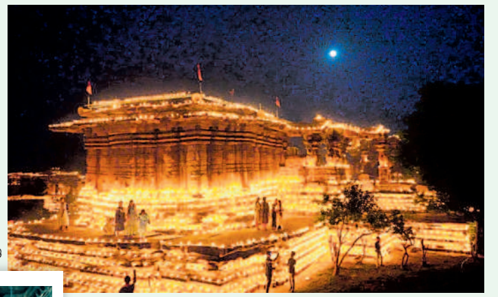
గణపరం: 11 వేల దీపాల కాంతుల్లో కోటగుట్ట