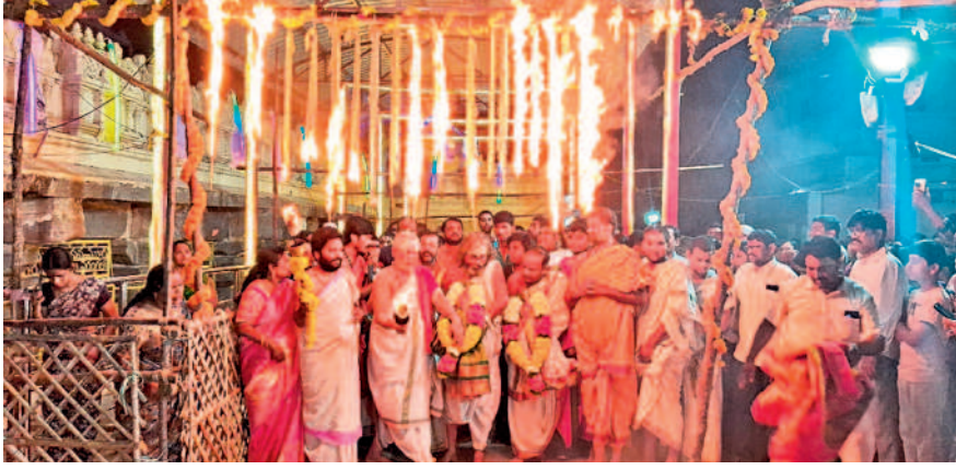
వరంగల్: భద్రకాళీ ఆలయంలో జ్వాలా తోరణం వెలిగించిన అర్చకులు, పాల్గొన్న భక్తులు