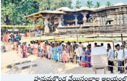
హనుమకొండ వేయిస్తంభాల ఆలయంలో క్యూలో భక్తులు