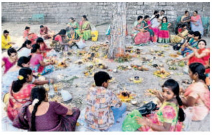
వేయిస్తంభాల దేవాలయంలో పూజలు చేస్తున్న భక్తులు