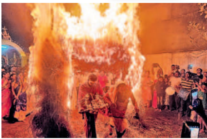
ఏటూరునాగారం: జ్వాలా తోరణం నుంచి దాటుతున్న భక్తులు