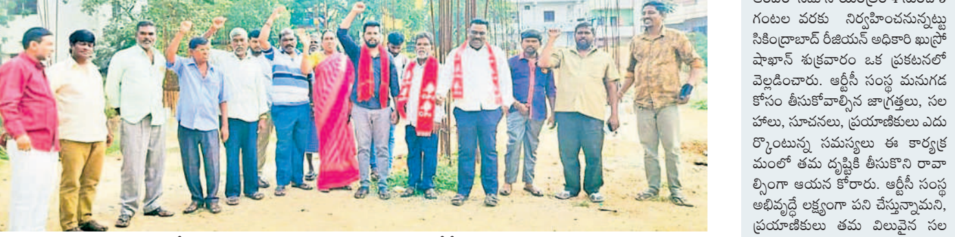
సీతాపల్లిపేట్ ప్రభుత్వ పాఠశాలను పరిశీలిస్తూ సీఐడీ నాయకులు