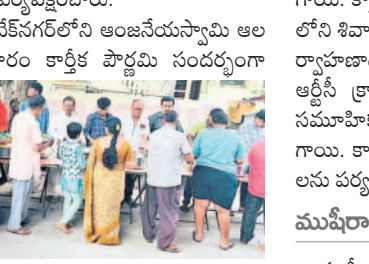
ముషీరాబాద్: కార్తిక పౌర్ణమి వేడుకలు ముషీరాబాద్