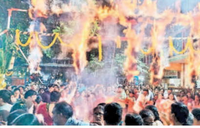
అమీర్పేట్: జ్యూలా తీరణం