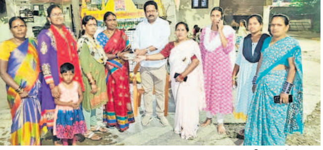
స్వయం సహాయక రుణాలు సద్వినియోగం చేసుకోవాలి