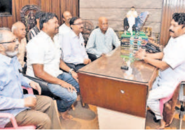
ఎమ్మెల్యేతో సమావేశమైన కాలనీ ప్రతినిధులు

తరం ఎమ్మెల్యేతో సమావేశమైన కాలనీలో ప్రతినిధులు దీర్ఘ కాలంగా ఎదురు చూస్తున్న పావులు, రోడ్ల నిర్మాణాలను చేపట్టాలన్నారు. కొనసాగుతున్న డ్రైనేజీ నిర్మాణాల పట్ల ఆనందాన్ని వ్యక్తం చేశారు. కాలనీలో నెలకొన్న తాగునీటి సమస్యను పరిష్కరించాలని ఎమ్మెల్యేను కోరారు.