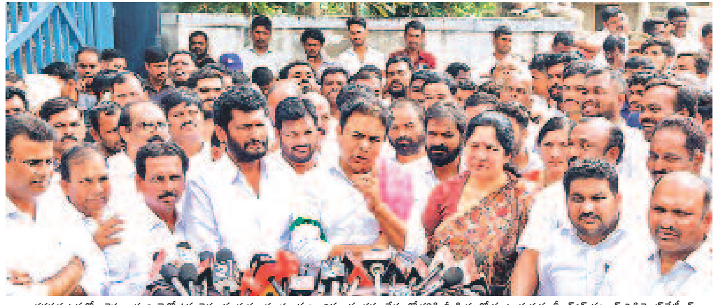
లగచర్ల పుటనలో అరెస్టులు కంది జైల్లో ఉన్న రైతులను శుక్రవారం పరామర్శించిన అనంతరం, నేతలతో కలిసి మీడియాతో మాట్లాడుతున్న బీఆర్ఎస్ వర్కింగ్ ప్రెసిడెంట్ కేటీఆర్

గిరిజనులపై దాడి అమానుషం కడుపు రగిలి లగచర్లలో తిరుగుబాటు రైతులను తక్కువగా విడుదల చేయాలి గిరిజన సంఘాల డిమాండ్ >4