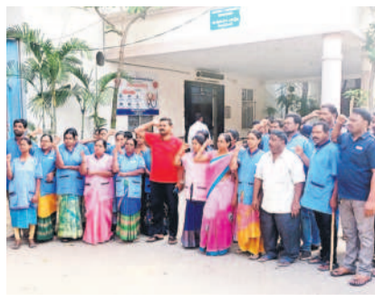
సిరిసిల్ల ప్రభుత్వ ప్రధాన దవాఖానలో ఎమ్మెల్యే ద్వారా వద్ద ధర్మా చేస్తున్న సిబ్బంది