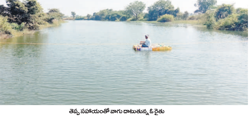
తప్ప సహాయంతో వాగు దాటుతున్న రైతు