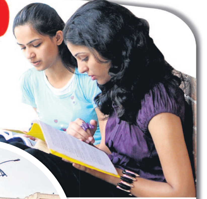
బాసర ట్రిపుల్ ఐటీ ప్రాంగణం

బాసర ట్రిపుల్ ఐటీలోని విద్యార్థులపై వర్కవేక్షణ కరువైంది. ఇందులో తొమ్మిది వేల మంది విద్యార్థులు ఉండగా.. ఇందులో దాదాపు ఐదు వేల మంది విద్యార్థులు విద్యను అభ్యసించారు. వీరందరినీ వర్కవేక్షణలోనికి నలుగురు మాత్రమే ఉమెన్ కేర్ టేకర్లు ఉన్నారు. హాస్టల్లో ఐదు వేల మంది విద్యార్థులకు దాదాపు 50 మంది కేర్ టేకర్లు, 20 మంది వార్డెన్లు, వది మందికి పైగా కౌన్సిలర్లు ఉండాలి. కానీ.. నలుగురు కేర్ టేకర్లు మాత్రమే ఉండడం సమస్యగా మారింది. సిబ్బందిని నియమించి, విద్యార్థుల యోగక్షేమాలు ఎమ్మెల్యే వర్కవేక్షణ ఆత్మహత్యలు పునరావృతం కాకుండా ఉండే అవకాశం ఉంది. కానీ.. నోటిఫికేషన్ వెలువడిన నుంచి ఇద్దరు విద్యార్థులు ఆత్మహత్య చేసుకున్నారు. - బాసర, నవంబర్ 13