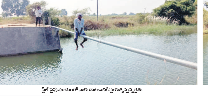
స్టీల్ పైపు సాయంతో వాగు దాటడానికి ప్రయత్నిస్తున్న రైతు