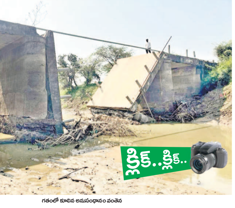
గతంలో కూలిన అనుంధానం వంతెన

సాగు కోసం రైతున్న సవాలక్ ఫీట్లు కల్లూరు-బారుగుప్పల్(కే) గ్రామాల మధ్య 30 ఏండ్ల క్రితం వాగుపై నిర్మించిన వంతెన తొమ్మిది నెలల క్రితం కూలింది. ఎన్నో దిన్న ఆధార్యంలో నిర్మించిన ఈ వంతెన పలు గ్రామాలకు రాకపోకలు సాగించేందుకు బీటలు ఉండేది. బారుగుప్పల్ కి చేరుకోవడానికి రైతులు కల్లూరు నుంచి వానల్ పాట్ ద్వారా తమ చేతులతోనే వచ్చేవారు. దాదాపు ఏడు కిలో మీటర్ల వరకు తిరిగి, వానల్ పాట్ రైతులు వాపొతున్నారు. మోత్యప్పల్, పెండవల్లి తదితర గ్రామాలకు వెళ్లడానికి రవాణా సౌకర్యం అగ్రింది. రైతులు పాలాలకు వెళ్లడానికి ఇబ్బందులు పడుతున్నారు. ఒక రైతు గత్యంతరం లేక తప్పని తయారు చేసుకుని తన వ్యవసాయ భూమికి రాకపోకలు సాగిస్తున్నారు. ఈత వచ్చిన వాళ్లు ఒక ఇనుప పైపు సాయంతో దాటుతున్నారు. ప్రమాదమని తెలిసినా రైతులు ప్రాణాలకు తెగించి వాగును దాటుతున్నారు. - కుంటూరి, నవంబర్ 13