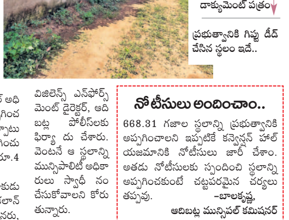
డాక్యుమెంట్ పత్రం ప్రభుత్వానికి గిఫ్టు డీడ్ చేసిన స్థలం ఇది..