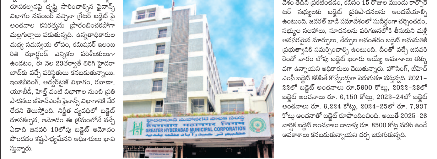
సిటీబ్యూరో, నవంబరు 12 (సమస్య తెలంగాణ): జీహెచ్ఎంసీలో పాలన గాడి తప్పిందని అనధానికి ఇదే ముఖ్యతన మాత్రమే.

సిటీబ్యూరో, నవంబరు 12 (సమస్య తెలంగాణ): జీహెచ్ఎంసీలో పాలన గాడి తప్పిందని అనధానికి ఇదే ముఖ్యతన మాత్రమే. అర్ధక సంవత్సరం పురోగతి కొత్త ప్రాజెక్టులు, మౌలిక వసతుల కొరతను దృష్టి సారించి యంత్రాంగం... పాలన వ్యవహారాలలోనే అది నిర్దిష్టతను ప్రదర్శిస్తున్నది.