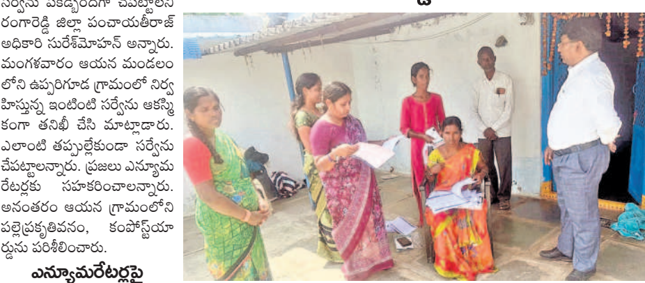
ఉప్పలగూడలో సర్వే జరుగుతున్న తీరును పరిశీలిస్తున్న డివీఎస్ సురేశ్ మోహన్

ఇట్రహంపట్టు రూరల్, నవంబరు 12 : సముగ్ర కుటుంబ సర్వేను పకడ్బందీగా చేపట్టాలి రంగారెడ్డి డివీఎస్ సురేశ్ మోహన్