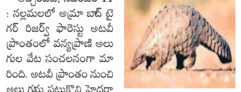
వన్యప్రాణి అలుగులపై వేటగాళ్ల కన్ను

అచ్చంపేట, నవంబర్ 11 : సల్లపల్లిలో అక్షరా బెర్ల ట్రి గర్ రిజర్వ్ ఫారెస్టు అలవిశాఖ ప్రాంతంలో వన్యప్రాణి అలుగులపై వేటగాళ్ల కన్ను. వేటగాళ్లు వేటగాళ్ల వేటగాళ్ల వేటగాళ్లు అంటూ ప్రజలు ఆరోపిస్తున్నారు. అధికారులు నిలిపివేసిన కిరాయిలను తగ్గించాలి అంటూ ధర్మం వ్యక్తం చేశారు. అధికారులు నిలిపివేసిన కిరాయిలను తగ్గించాలి అంటూ ధర్మం వ్యక్తం చేశారు.