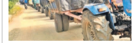
మిల్లు వద్ద వాహనాల బారులు

మాసాపేట (అడ్డూరు), నవంబర్ 11 : అడ్డూరుల మండల కేంద్రంలో ఎన్ఎస్ఐ కాలనీ మిల్లు వద్ద పత్తి రైతులు పడిగా పట్టు కాస్తున్నారు. అధికారులు మిల్లులో పత్తి కొనుగోలు కేంద్రం ఏర్పాటు చేయాలి. రైతులు తెల్ల పాత్ర అమ్మకం చేయాలి అంటూ ప్రజలు కోరుతున్నారు. అధికారులు నిలిపివేసిన కిరాయిలను తగ్గించాలి అంటూ ధర్మం వ్యక్తం చేశారు. అధికారులు నిలిపివేసిన కిరాయిలను తగ్గించాలి అంటూ ధర్మం వ్యక్తం చేశారు.