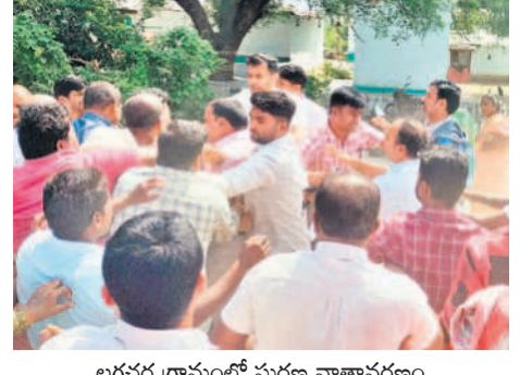
లగవల్ల గ్రామంలో సుదీర్ఘ వాతావరణం

కోడంగల్ పరిధిలో ఏర్పాటు చేస్తున్న ఫార్మాసీటీ కోసం గిరిజనుల భూములు లాక్కునేందుకు ప్రయత్నం జరుగుతుంది. బోంబాయి, దువ్వాల మండలంలో ఎక్కువ మంది లంబా డాలు నివసిస్తున్నారు. ఇప్పుడు ఏర్పాటు చేసే ఫార్మాసీటీ కోసం నిలబడి వ్యవసాయ సాయుధ సమితిని ఏర్పాటు చేసి కుటుంబాలు జీవిస్తున్నాయి. వీరంతా చిన్న, సన్నకారు రైతులే. కేసీఆర్ ప్రభుత్వ హయాంలో కాలం కలిసి రావడంతో వలస పోయిన వారంతా తిరిగి వచ్చారు. వ్యవసాయ సాయుధ సమితిని నాలుగు ముద్దుల నోట్ల పెట్టుకునే టైంలో ఫార్మాసీటీ పేరుతో ఈ రైతుల భూములు లాక్కునే ప్రయత్నం ప్రభుత్వం చేస్తుంది. ఈ సేవలందరూ ఫార్మాసీటీకి తమ భూములు ఇచ్చేది లేదని తేల్చి చెప్పారు. అందుకే వ్యాఖ్యానం తెగించి తిరగబడ్డారు. ప్రస్తుతం ఏం జరుగుతుంది అనే అందరినీ గ్రామస్థుల్లో నెలకొంది. రెండు మండలాలలోని గ్రామాలు భయం గుప్పిల్లో ఉండిపోయాయి. తాము ఓటు వేసిన నాయకుడు సీఎం అయ్యాడని ఆనందవారం.. పెద్దల కోసం గద్దూరు తమ భూమిని లాక్కుంటున్నారని బాధపడే వారంతా తిరిగి పరిస్థితి నెలకొన్నది.