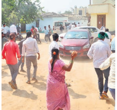
అధికారుల వాహనాలపై రాళ్లును రువ్వుతున్న ఆందోళనకారులు

తో పాటిపోవాల్సిన పరిస్థితి నెలకొంది. ప్రభుత్వం విశాఖ బాద్ జిల్లా కోడంగల్ నియో జకవర్గంలోని బోంబాయి, దువ్వాల మండలంలో ఫార్మా కంపెనీ నిలను ఏర్పాటుకు రంగం సిద్ధం చేసింది. గతంలో కేసీఆర్ ప్రభుత్వ హయాంలో హైదరాబాద్ నియో జకవర్గంలోని ఆమనగల్, కడల్, ఇల్లా పోలట్లం సమీపంలోని ఫార్మాసీటీ కోసం భూములు గుర్తించారు. ఇక్కడ అంతా ప్రభుత్వ భూములే ఉండడంతో రైతులు, ప్రజల నుంచి పెద్దగా వ్యతిరేకం రాలేదు. అయితే కాంగ్రెస్ ప్రభుత్వం ఈ ఫార్మాసీటీ అక్కడి నుంచి మార్చింది. కోడంగల్ నియో జకవర్గం నుంచి గిరిజి అంటూ ఒకా దాని అన్న రకాలను సంస్కరించడం కోసం ప్రభుత్వం ఈ ఫార్మాసీటీని ఏర్పాటు చేసేందుకు గ్రీన్ సిగ్నల్ ఇచ్చారు. ఇక్కడ అసలు టెన్షన్ మొదలైంది. ఇప్పుడు ఏర్పాటు చేసే భూములను వినిపించుకుంటూ రావడం కోసం ప్రభుత్వం ఏర్పాటు చేసిన భూములు లాక్కునే ప్రయత్నం చేసి బతుకు తప్పని స్థితిని సృష్టించారు. ప్రజాభిప్రాయ సేకరణ చేయడం కోసం ప్రభుత్వం ఏర్పాటు చేసిన భూములు లాక్కునే ప్రయత్నం చేసి బతుకు తప్పని స్థితిని సృష్టించారు.