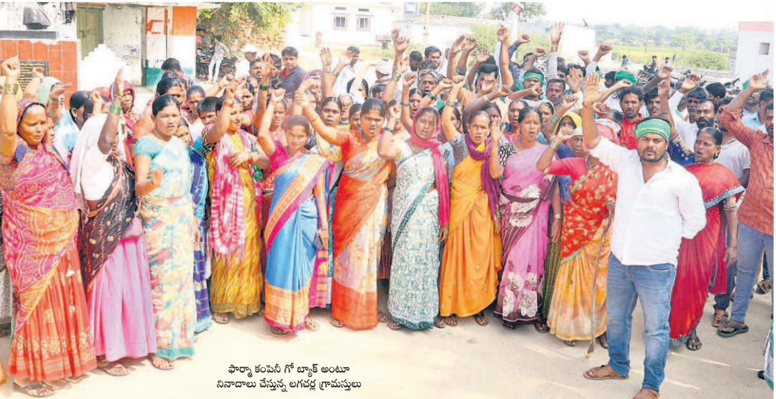
ఫార్మా కంపెనీ బ్యాంక్ అంటూ నిరాదాన చేస్తున్న లగవల్ల గ్రామస్థులు