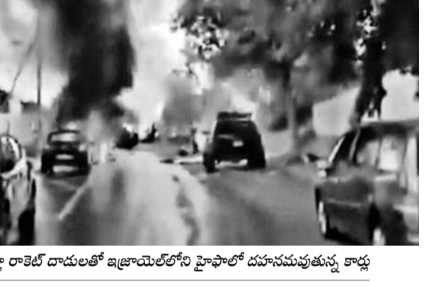
హెచ్చెల్లా రాకెట్ దాడులతో ఇజ్రాయెల్ లోని హెచ్చెల్లా దహనమవుతున్న కార్లు

టీరుట్, నవంబర్ 11: ఇజ్రాయెల్-హెచ్చెల్లా మధ్య పోరు మరింత తీవ్రరూపం దాల్చింది. లెబనాన్ లోని హెచ్చెల్లా నుంచి ఇజ్రాయెల్ పై వరుస రాకెట్ దాడులతో వరుసగా క్షిపణులు విరిచుకుపోయాయి. ఇజ్రాయెల్ సగం హెచ్చెల్లా లక్ష్యంగా 90కి పైగా క్షిపణులు విరిచుకుపోయాయి. ఈ దాడుల్లో హెచ్చెల్లాలో పలు భవనాలు దెబ్బతిన్నాయని, పలువురు గాయపడ్డారని, వాహనాలు ధ్వంసమయ్యాయని మీడియా కథనాలు వేర్పాటుగా ఉన్నాయి. హెచ్చెల్లా ప్రయోగించిన పలు మిస్సైల్స్ ను ఇజ్రాయెల్ రక్షణ వ్యవస్థ 'ఇరన్ డోమ్' ఆడ్డుకున్నట్లు టి.వి.లో కనపడ్డాయి. హెచ్చెల్లాలో పలు జనావాస ప్రాంతాల్ని తాకాయని తెలిసింది. ఒక చిన్నారుల సహా నలుగురు వ్యక్తులు తీవ్రంగా గాయపడ్డారని ప్రాథమిక సమాచారం. హెచ్చెల్లా రాకెట్ దాడుల్ని ఇజ్రాయెల్ భద్రతా బలగాలు (ఐడిఎఫ్) ప్రతిఘటించాయి. హెచ్చెల్లా పట్టణం శివారు ప్రాంతాల్ని మిస్సైల్స్ తాకాయని ఐడిఎఫ్ వేర్పాటుచేసింది.