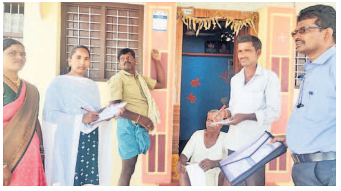
గొడుగోపల్లిలో సర్వే పనులను పరిశీలిస్తున్న ఎంపీడివో