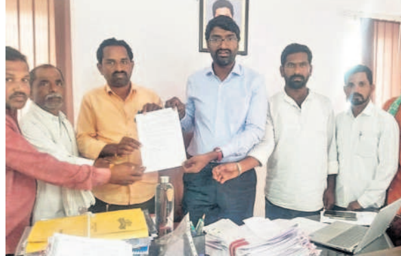
కడా ప్రత్యేకాధికారికి వినతిపత్రాన్ని అందిస్తున్న తండా వాసులు