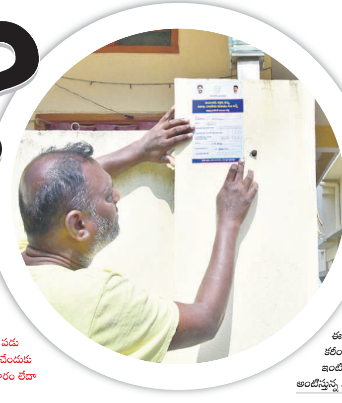
ఈనెల 8వ కరీంనగర్లో ఇంటింటి కుటుంబ సర్వే సీట్లను పంపిణీ చేస్తున్నారు

ప్రభుత్వం ఈ నెల 8వ తేదీ నుంచి చేపట్టిన సామాజిక, ఆర్థిక, విద్య, ఉపాధి, రాజకీయ కుల సర్వే (సమగ్ర ఇంటింటి కుటుంబ సర్వే)లో అసలు పుట్టం నేటి నుంచి మొదలు కాబోతున్నది. మూడు రోజులుగా చేస్తున్న హాస్ లిస్టింగ్ సర్వే శుక్రవారం రాత్రి వరకు పూర్తిచేయడం యంత్రాంగం భావించినా, పలు జిల్లాల్లో పూర్తికాలేదు. దీంతో నాలుగో రోజు శనివారం కూడా కొనసాగించాలని నిర్ణయించిన అధికారులు, ఇదే సమయంలో ఇంటింటి కుటుంబ సర్వే ప్రారంభానికి సన్నాహాలు చేస్తున్నారు. అయితే ప్రశ్నలకు సంబంధించి ఫార్మాట్ మారడంతో మళ్లీ ఆగమేపూల మీద ఏ జిల్లాకు ఆ జిల్లా ఫారాల ముద్రణకు ఆదేశాలు ఇచ్చారు. అయితే ఇవి శనివారం ఉదయం వరకు కూడా అందరికీ అందేలా లేవని తెలుస్తున్నది. దీంతో హైదరాబాద్ తమకు అధికారులు.. ఆ మేరకు ఎన్యూమరేటర్లకు ప్రత్యామ్నాయ విధాలు అప్పగించేందుకు చర్యలు తీసుకుంటుండగా, ఉమ్మడి జిల్లావ్యాప్తంగా పూర్తి స్థాయిలో సర్వే అధికారుల లేదా సోమవారం నుంచి ప్రారంభమయ్యే అవకాశం కనిపిస్తున్నది.