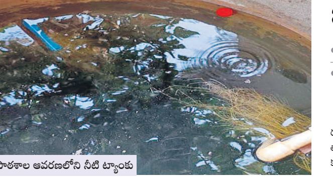
పాఠశాల ఆవరణలోని నీటి ట్యాంకు