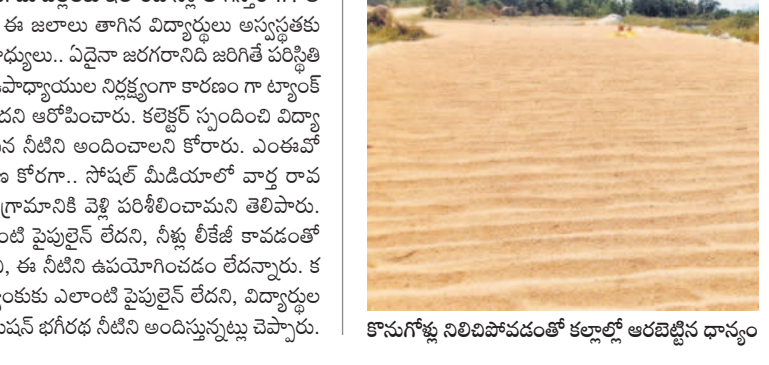
కొనుగోళ్ల నిలిపివేయడంతో కల్లెర్ల ఆరబడిన దాస్యం