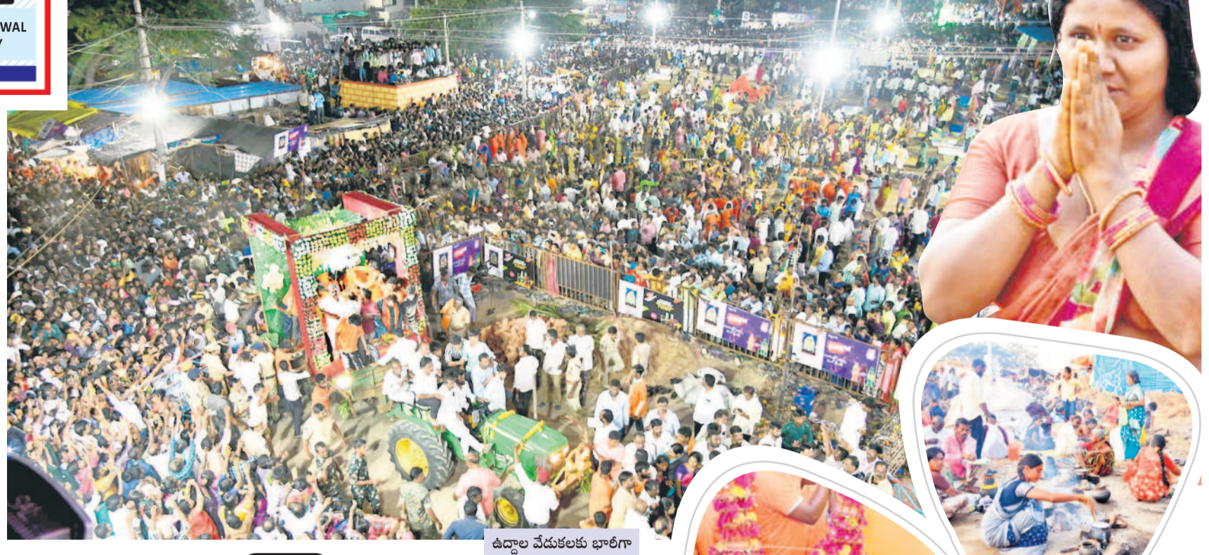
ఉద్దాలోత్సవం భాగంగా చేసిన భజనం

జిల్లా కేంద్రంలోని ప్రముఖ పాఠశాలలో కూడా డీకేఎం భాగస్వామిగా ఉన్నట్లు తెలుస్తోంది. కొన్నేళ్లుగా ఇక్కడే తిష్టవేసిన ప్రతి అధికారిని తన కమన్వెల్త్ పెట్టుకుని.. అంతా ఆయన చేతుల్లోనే నడిపే వారని సమాచారం. ఫిర్యాదులు వచ్చినా చర్యలు మాత్రం శూన్యం. దీన్ని ఆసరాగా చేసుకొని ఆయన పాఠశాలలపై చర్యలు తీసుకోకుండా ఉండేందుకు గాను సజరాగా స్కూల్ యాజమాన్యం పార్ట్నర్షిప్ ఆఫ్ ఇచ్చినట్లు తెలుస్తోంది. దీంతో మాడూ, నాలుగు పాఠశాలల్లో భాగస్వామిగా ఉన్నట్లు ఉపాధ్యాయ వర్గాల్లో అంటున్నారు. పలు ప్రైవేట్ పాఠశాలలు ఆయన అండచూసారని చెప్పినా పట్టించుకునే నాటుడే కరువయ్యారు. ఇందుకు కారణంగా ఇలాంటి అవినీతి అధికారే అన్న విమర్శలు వినిపిస్తున్నాయి.