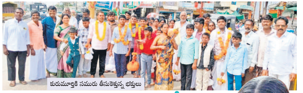
కురుమూర్తి సమురు తీసుకొచ్చిన భక్తులు