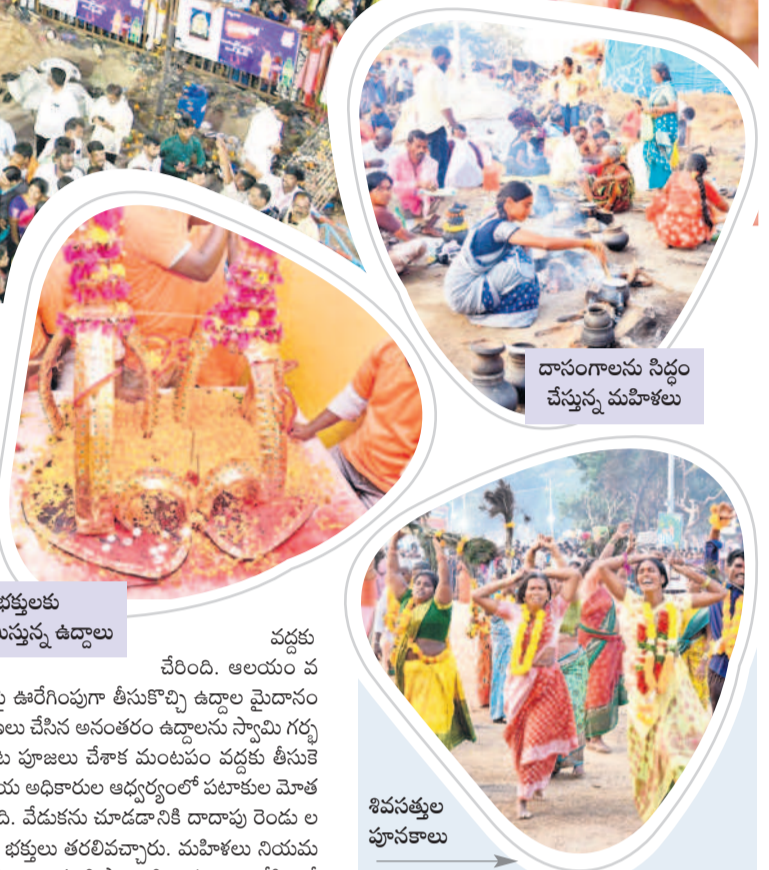
దాసంగాలను సిద్ధం చేస్తున్న మహిళలు