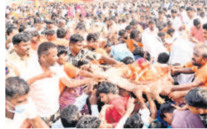
ఉద్దాలను ఊరేగింపుగా తీసుకొచ్చిన భక్తులు

దేవరకల్ల రూరల్ (చిన్నచింతకుంభ), నవంబర్ 8 : అప్పంపల్లి నుంచి అమ్మపూర్ వరకు జన జాతర.. ఊకడెమ్మ వాగు భజనసంధ్రమైంది.. దారిపాడవునా కురుమూర్తి రాయడి పాదుకలు (ఉద్దాలు) తాకి భక్తులు పరవశించిపోయారు. శివసత్తుల పూసకాల్తో ఊగిపోయారు. శుక్రవారం సాయంత్రం కురుమూర్తి ఉద్దాలు