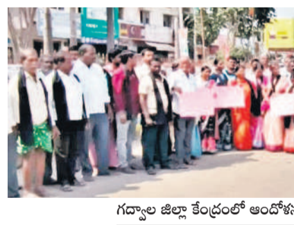
గద్వాల జిల్లా కేంద్రంలో ఆందోళన చేస్తున్న అఖిల పక్షం నాయకులు