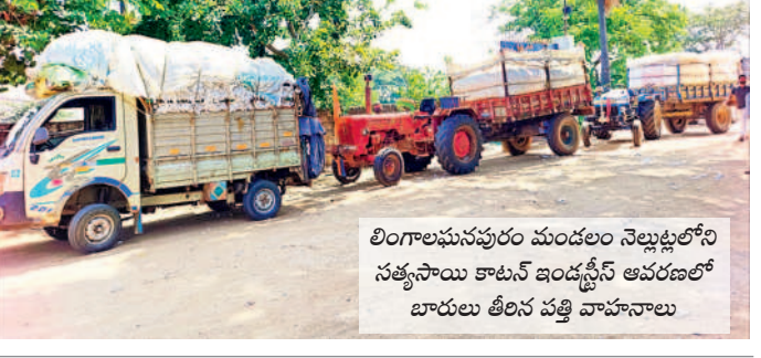
లింగాలమునపురం మండలం వెట్టుబడిలోని సమస్తి తెలంగాణ కాటన్ ఇండస్ట్రీస్ ఆవరణలో బారులు తీరిన పత్రిక వ్యాపారులు

తీసుకుపోవాలంటే కిరాయి మీద పడి రవాణా ఖర్చు తడిసి మోపడం వుంది. దీంతో తేమ, పత్రిక నల్లబారిపోయిందనే సాకుతో ప్రైవేట్ అమ్ముకొని ఇంటికి పోవాలి. ఒకసారి ఇంటి నుంచి వాహనంలో తెచ్చిన పత్రిక మళ్లీ