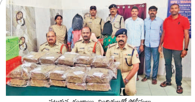
పట్టుకున్న గంజాయి, నిందితులతో పోలీసులు