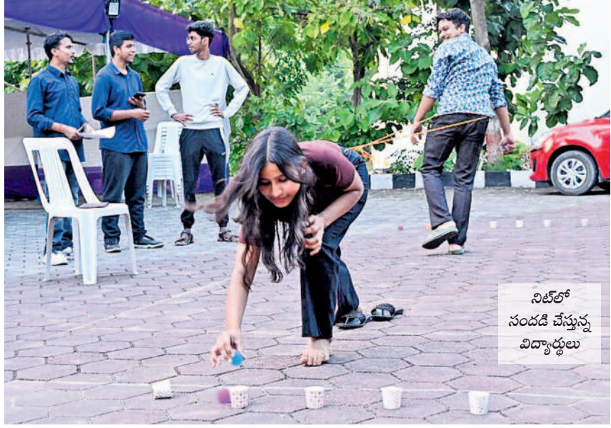
నిట్లో సందడి చేస్తున్న విద్యార్థులు