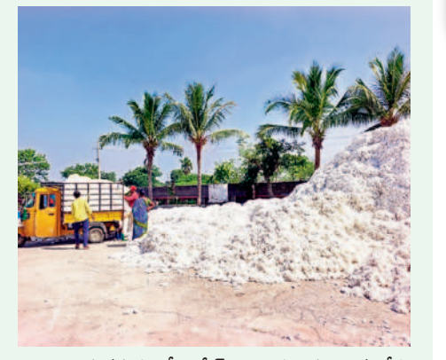
లింగాలమునపురంలో ప్రైవేట్ వ్యాపారుల పత్రిక కొనుగోళ్లు

సీనియర్ తీరుతో పత్రిక కన్నీరు పెడుతున్నాడు. ఆరుగంటల కళ్లపడి పండించిన దూరిని అమ్ముకుండామంటే తేమ పేరుతో తిరస్కరిస్తుండడంతో విధిలేక అడిగిన కాడికి ప్రైవేట్ వ్యాపారులకు అమ్ముకోవాల్సిన దుస్థితి నెలకొంది. జనగామ జిల్లాలోని వివిధ ప్రాంతాల్లోని ప్రైవేట్ మిల్లుల్లోనే ఓ వైపు సీనియర్, మరోవైపు దళారులు పత్రిక కొనుగోలు చేస్తున్నారు. తేమ సాకుతో సీనియర్ కొనకపోవడంతో రైతులు పత్రిక వేరేచోటకు తరలించడం దాని వాహన కిరాయి భారమని భావించి అనివార్యంగా పక్కనే ఉన్న ప్రైవేట్ వ్యాపారులకు అమ్ముకోవాల్సి వస్తున్నది. అక్కడ రిమోట్లో తెలివిగా తూకంలో మోసం చేస్తున్నారు. అనంతరం అదే పత్రిక సీనియర్ విక్రయం చేస్తున్నారు. అదేవిధంగా 2 శాతం కమిషన్ సహా అన్ లోడింగ్ చార్జీల పేరుతో మిల్లుల నిర్వాహకులు, ప్రైవేట్ వ్యాపారులు, దళారులు సిండికేట్ గా మారి దోపిడీకి పాల్పడుతున్నారు. - జనగామ, నవంబర్ 8 (సమస్తి తెలంగాణ)