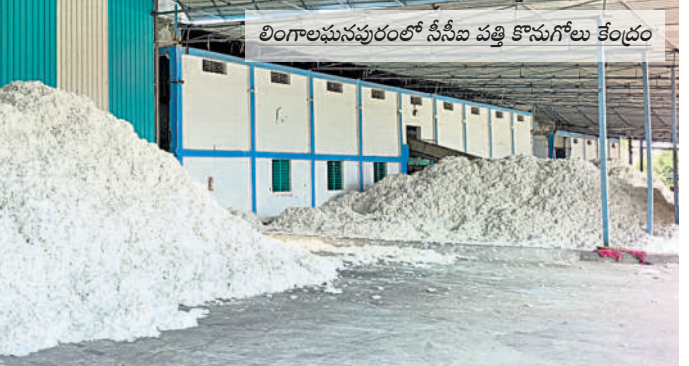
లింగాలమునపురంలో సీనియర్ పత్రిక కొనుగోలు కేంద్రం