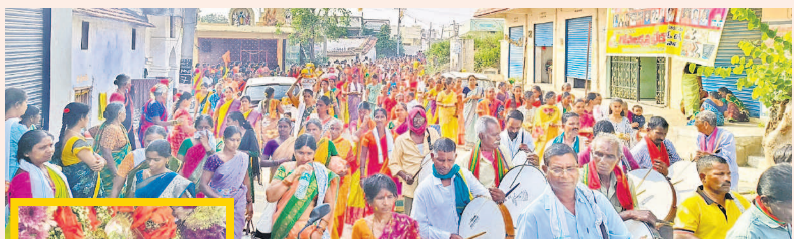
ఉత్తర విగ్రహాల ఊరేగింపులో పాల్గొన్న భక్తులు