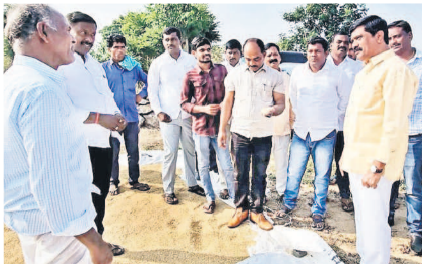
మోర్రాడ్లో ధాన్యం కల్లం వద్ద రైతులతో మాట్లాడుతున్న మాజీ మంత్రి, ఎమ్మెల్యే వేముల ప్రశాంత్ రెడ్డి