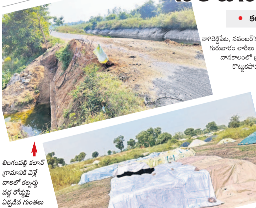
లింగంపల్లి కలాన్ గ్రామానికి వెళ్లే దారిలో కల్లం వద్ద రోడ్డుపై ఏర్పడిన గుంతలు

వడం ఆలస్యమైందనూ, ఇప్పటికే ప్రైవేటు వ్యాపారులకు అమ్ముకున్న రైతులకు కూడా క్రింటాటాలు రూ.500 బోనస్ చెల్లించాలని డిమాండ్ చేశారు. అన్ని రకాల వడ్లకు రూ.500 బోనస్ చెల్లించి కొనుగోలు చేయాలన్నారు. దశా రులకు అమ్ముకున్న వడ్లకు కూడా బోనస్ చెల్లించాలన్నారు. ఎన్నికల్లో హామీ ఇచ్చినట్లుగానే అన్ని రకాల వడ్లకు బోనస్ చెల్లించాలని డిమాండ్ చేశారు.