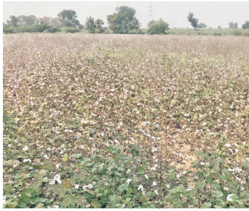
అదిలాబాద్ జిల్లా మావల మండలం బట్టి సవరణతో ఓ రైతు చేనులో విరగబూసిన పత్తి