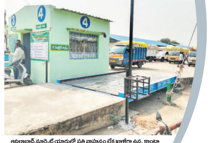
అదిలాబాద్ మార్కెట్ యార్డులో పత్తి వాహనం లేక ఖాళీగా ఉన్న కాంటూ

కిలో పత్తి రూ.10 చొప్పున రైతులు చెల్లిస్తున్నారు. ఒక్కో కూలీ రోజు 60 కిలో వరకు పత్తి తీస్తుండగా.. దీంతో వారికి రూ.600 వరకు గట్టుబాటు అవుతుందని రైతులు అంటున్నారు. పత్తి తీసేవారిని అదిలాబాద్ పట్టణంలోని వివిధ ప్రాంతాలతో పాటు మండల కేంద్రాల నుంచి ఆటోలో తీసుకొస్తున్నామని, ఆటో కిరాయి కూడా తాము భరించాల్సి వస్తుందని రైతులు ఆవేదన చెందు తున్నారు. జిల్లాలోని కాన్స, తలమడుగు, ధీంపూర్, జైసంట్, బేల మండలాల్లో పలు గ్రామాల్లో