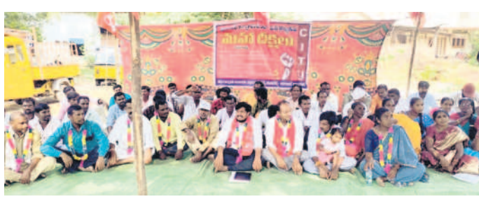
కలెక్టరేట్ ఎదుట చేపట్టిన మహాదీక్షలో పాల్గొన్న పంచాయతీ కార్యకులు

బజార్ హత్యార్ ఎంపీడీవో కార్యాలయ సిబ్బంది సమయ పాలన పాటించడం లేదు. గురువారం ఉదయం 11 గంటల దాటినా సిబ్బంది విధులకు రాలేదు. దీంతో కుర్చీలు ఖాళీగా దర్శనమిచ్చాయి. జూనియర్ అసిస్టెంట్ సెలవులో ఉండడంతో సూపరింటెండెంట్ ముఖ్యులను, సీనియర్ అసిస్టెంట్ కాంచనమాల ఆఫీసుకు రాలేదు. సమగ్ర కుటుంబ సర్వే గోడ ప్రతులు సీనియర్ అసిస్టెంట్ కాంచనమాలకు వెందిన బీరువాలి ఉండడంతో అధికారుల రాక కోసం పంచాయతీ కార్యదర్శులు కార్యాలయం వద్ద వడిగావులు కాశారు. ఈ విషయమై ఎంపీడీవో శ్రీనివాసను వివరణ కోరగా.. సమయపాలన పాటించని అధికారులపై శాఖ పరమైన చర్యలు తీసుకుంటామని పేర్కొన్నారు. - బజార్ హత్యార్, నవంబర్ 7