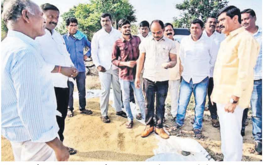
మోర్లాడ్ లో ధాన్యం కల్లం వద్ద రైతులతో మాట్లాడుతున్న మాజీ మంత్రి, ఎమ్మెల్యే వేముల ప్రశాంత్ రెడ్డి