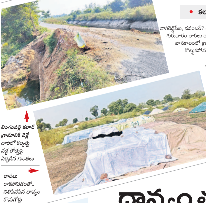
లింగంపల్లి కలాన్ గ్రామానికి వెళ్లే దారిలో కల్లం వద్ద రోడ్డుపై ఏర్పడిన గుంతలు

పడం ఆలస్యమైనందున, ఇప్పటికే ప్రైవేటు వ్యాపారులకు అమ్ముకున్న రైతులకు కూడా క్రింటాలకు రూ.500బోనస్ చెల్లించాలని డిమాండ్ చేశారు. అన్ని రకాల వడ్లకు రూ.500బోనస్ చెల్లించి కొనుగోలు చేయాలన్నారు. దశా రులకు అమ్ముకున్న వడ్లకు కూడా బోనస్ చెల్లించాలన్నారు. ఎన్నికల్లో హామీ ఇచ్చినట్లుగానే అన్ని రకాల వడ్లకు బోనస్ చెల్లించాలని డిమాండ్ చేశారు.