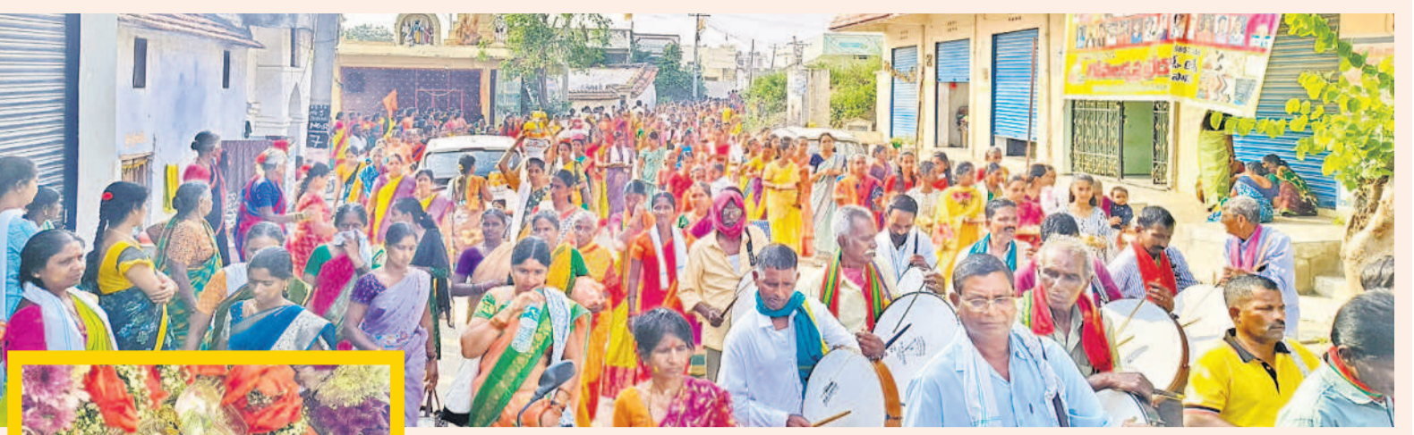
ఉత్సవ విగ్రహాల ఊరేగింపులో పాల్గొన్న భక్తులు