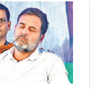
నవంబర్ 5, 2024

నవంబర్ 25, 2023 అసెంబ్లీ ఎన్నికల ప్రచారం సందర్భంగా కాంగ్రెస్ విజయభేరి యాత్రలో భాగంగా కాంగ్రెస్ అగ్రనేత రాహుల్ గాంధీ హైదరాబాద్ లోని ఆశోక్ నగర్ లో పర్యటించారు. నిరుద్యోగులను కలిసి అంటూ ఉంటానని హామీ నిచ్చారు. ఉద్యోగాల భర్తీ విషయంలో నాటి ప్రభుత్వంపై ఆరోపణలు గుప్పించారు. తమ ప్రభుత్వం అధికారంలోకి వస్తే ఏడాదికి 2 లక్షల ఉద్యోగాలు ఇస్తామంటూ చెప్పారన్నారు. అధికారంలోకి వచ్చాక బాపల్లె హోటల్ లో బిర్లాస్ టిండామంటూ వారికి చెప్పారు.