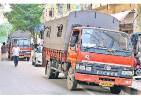
హైదరాబాద్ లో రాహుల్ పర్యటన నేపథ్యంలో ఇందిరాపార్క్ నుంచి ఆశోక్ నగర్ వైపు మోహరించిన పోలీసు వాహనాలు

నిరుద్యోగులు కోరినా ఆశోక్ నగర్ రాలే ఎన్నికలయ్యాక పట్టించుకోని కాంగ్రెస్ తాజా పర్యటనలో పోలీసుల మోహరింపు నిరుద్యోగులు బయటకు రాకుండా పహారా హైదరాబాద్/సిటీబ్యూరో, నవంబర్ 5 (నమస్తే తెలంగాణ): ఎన్నికల ముందు నిరుద్యోగుల వద్దకు వచ్చిన రాహుల్ గాంధీ అరచేతిలో వైకుంఠం చూపారు. కాంగ్రెస్ పార్టీ అధికారంలోకి వచ్చిన వెంటనే ఏడాదికి 2 లక్షల ఉద్యోగాలు అందిస్తామని నాడు ఉమ్మడిగా ఇచ్చారు. ఒక్కో ఆశ్చర్య భూజాల్ని తడుతూ తానున్నానని నమ్మబలికించారు. నాడు ఆశోక్ నగర్ రాహుల్ కోసం >6వ పేజీలో