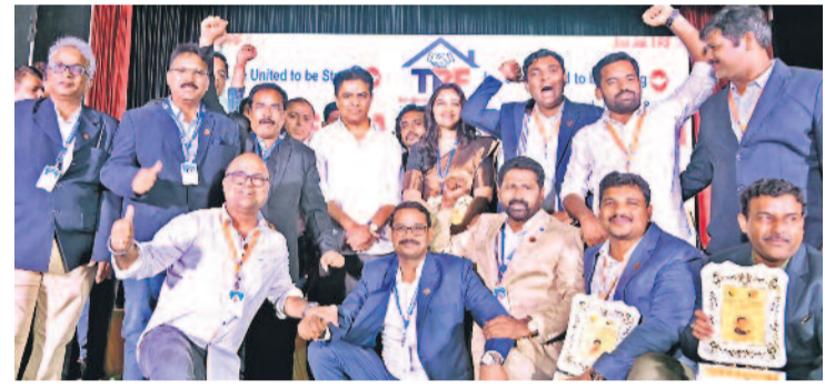
శ్రీనగర్ కాలనీలో నిర్వహించిన సమావేశంలో తెలంగాణ రియల్టర్స్ ఫోరం ముఖ్యులతో కేటీఆర్