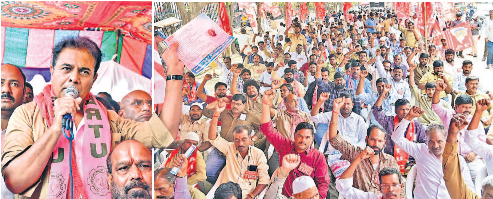
హైదరాబాద్ లోని ఇందిరాపార్క్ ధర్నాలో తెలంగాణ రాష్ట్ర ఆటోడ్రైవర్స్ యూనియన్ జేపీసీ అధ్యక్షులతో నిర్వహించిన మహాధర్నాకు తరలివచ్చిన ఆటోడ్రైవర్లను ఉద్దేశించి మాట్లాడుతున్న కేటీఆర్

PUBLISHED FROM HYDERABAD • KARIMNAGAR • WARANGAL • KHAMMAM • NALGONDA • MAHABUBNAGAR • NIZAMABAD www.ntnews.com 06 /ntdailyonline