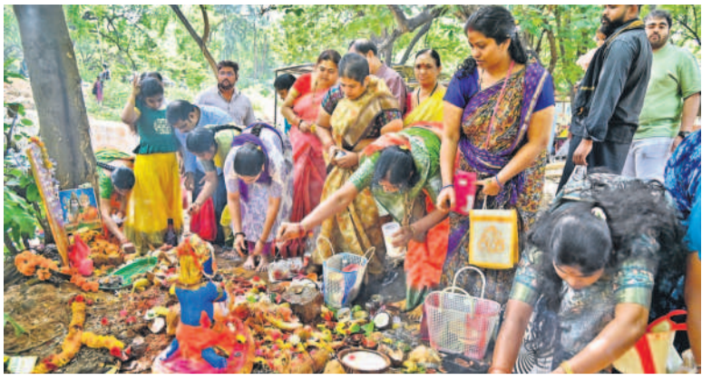
నాగుల చవితి > కార్మిక మానవ నాగుల చవితి సందర్భంగా నాగదేవతను పూజిస్తున్న భక్తులు