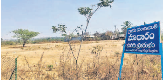
మోదీరం ముఖ్యమంత్రి పరిధిలో ఉన్న భూమి

మేడ్చల్, నవంబర్ 5 (నమస్తే తెలంగాణ) : మేడ్చల్-మల్కాజిగిరి జిల్లా మాదారం ఇండస్ట్రీయల్ పార్క్ (పారిశ్రామికవాడ) ప్రారంభానికి నోచుకోవడం లేదు. గత టీఆర్ఎస్ ప్రభుత్వ హయాంలో ఈ పార్క్ ఏర్పాటుకు రూ. 80 కోట్ల నిధులు వెచ్చించి 186 ఎకరాల భూమిని కేటాయించింది. ఈ భూమిని రివెన్యూ అధికారులు టీఎస్ఎస్ఎల్ఐ అప్పగించి ఇండస్ట్రీయల్ పార్క్ ఏర్పాటుకు లైసెన్స్ క్లియర్ చేశారు. కానీ, ఇండస్ట్రీయల్ పార్క్ పనులు ప్రారంభంలో కాంగ్రెస్ ప్రభుత్వం నిర్లక్ష్యం చేస్తున్నదనే ఆరోపణలు వస్తున్నాయి. టీఎస్ఎస్ఎల్ఐ భూమి కేటాయింపిన క్రమంలో అభివృద్ధి పనులు చేపట్టాలి ఉంది. అయితే, అభివృద్ధి పనులు ప్రారంభం పై తమకు ప్రభుత్వం నుంచి ఎలాంటి సమాచారం లేదని అధికారులు చెబుతున్నారు.