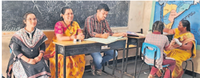
కులకర్ణ, నవంబర్ 4 : మండల కేంద్రంలోని కేజీబీబీ పాఠశాలలో ప్రాథమిక ఆరోగ్య కేంద్రం ఆధ్వర్యంలో సోమవారం వైద్యశిబిదం నిర్వహించారు. 6, 7 వ తరగతి అమ్మాయిలకు హిమోగ్లోబిన్ పరీక్షలు నిర్వహించినట్లు పాఠశాల ఎన్ఎస్ డిబి తెలిపారు. కేంద్ర వైద్యశాఖ ఆదేశాల మేరకు ఈ కార్యక్రమాన్ని నిర్వహించినట్లు తెలిపారు. బాలికల్లో రక్తహీనతపై అవగాహన కల్పించడంతో పాటు పరీక్షలు నిర్వహించినట్లు తెలిపారు. కార్యక్రమంలో వైద్యసిబ్బంది, కేజీబీబీ పాఠశాల అధ్యాపకులు, విద్యార్థులు పాల్గొన్నారు.