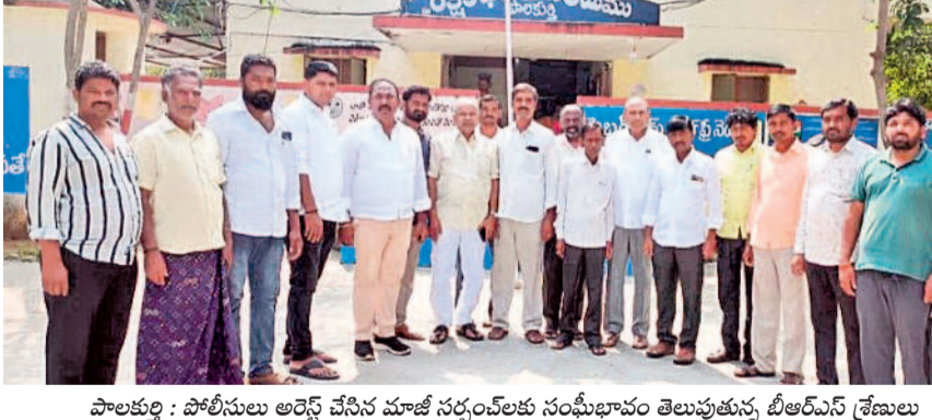
పాలకورت : పోలీసులు అరెస్టు చేసిన మాజీ సర్పంచ్ లకు సంఘీభావం తెలుపుతున్న బిఆర్ఎస్ శ్రేణులు

దేవరపల్లె / హనుమకొండ / తా. ప్రాలు: కేసీఆర్ తెచ్చిన బంగారం భాగస్వామ్యంపై ఎలరెడ్డి దయాకర్ రావు సర్కారులను తీర్చిదిద్ది కేంద్రం నుంచి అనేక ఉత్తమ అవార్డులు తెచ్చిపెట్టిన సర్పంచ్ లు ఈ ప్రభుత్వం అక్రమంగా అరెస్టు చేసి ప్రజాపాలన అంటే ఇదేనని చాటుతున్నదని మాజీ మంత్రి ఎలరెడ్డి దయాకర్ రావు అన్నారు. పెండింగ్ బిల్లుల కోసం పోరుతుంటే పిలుపునిచ్చిన మాజీ సర్పంచ్ లు అరెస్టు చేయడాన్ని తీవ్రంగా ఖండిస్తున్నట్లు ఆయన తెలిపారు. విధిలేక పోరుతుంటే పడితే అరెస్టులు చేయడం దుర్మార్గమైన చర్య అని పేర్కొన్నారు. తాము అధికారంలోకి రాగానే సర్పంచ్ లు పెండింగ్ బిల్లులు వెంటనే చెల్లిస్తామని కాంగ్రెస్ ప్రభుత్వం ప్రకటించింది, 11 నెలలు గడుస్తున్నా ఉలుకూపలకూ లేకపోవడంతో మాజీ సర్పంచ్ లంతా పోరుతుంటే పట్టణం, వారికి టీఆర్ఎస్ పార్టీ అండగా నిలుస్తుందన్నారు. ఆస్తులు అమ్మి అప్పుల పాలైన మాజీ సర్పంచ్ లకు బిల్లులు చెల్లించాల్సింది పోయి అరెస్టులు చేస్తున్న ఈ ప్రభుత్వానికి రాజీయే స్థానిక సంస్థల ఎన్నికల్లో భాగపాలు తప్పవన్నారు. బడా కాంట్రాక్టర్లకు బిల్లులు చెల్లిస్తూ, చిన్న పనులు చేసిన మాజీ సర్పంచ్ లు మాత్రం బిల్లులు చెల్లించకపోవడంతో అంతర్గత ఏమిటానీ ఆయన ప్రశ్నించారు. అక్రమంగా నిర్బంధించి, అరెస్టులు చేసిన మాజీ సర్పంచ్ లు బేషరతుగా విడుదల చేయాలని, పెండింగ్ బిల్లులను తక్షణం చెల్లించాలని మాజీ మంత్రి ఎలరెడ్డి దయాకర్ రావు డిమాండ్ చేశారు.