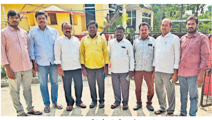
బచ్చన్నపేట : ముందస్తు అరెస్టు చేసిన మాజీ సర్పంచ్ లతో పోలీసులు