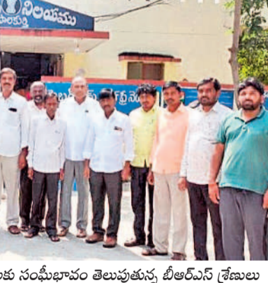
బోతుపల్లె : పోలీస్ స్టేషన్ లో మాజీ సర్పంచ్ లు

ఎన్నికలను నిర్వహించాలని, లేదంటే పెద్ద ఎత్తున ఆందోళనలు చేపడతామని హెచ్చరించారు.