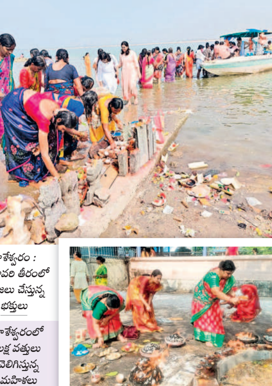
కాళేశ్వరం : గోదావరి తీరంలో పూజలు చేస్తున్న భక్తులు