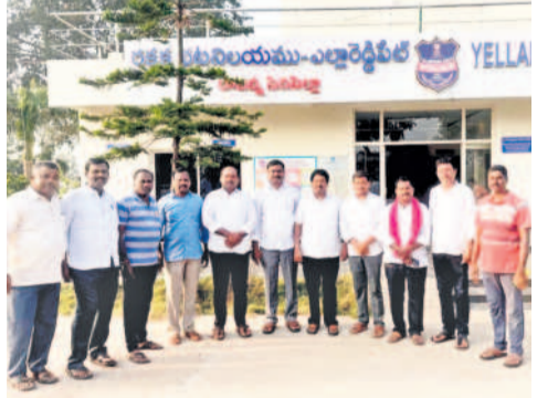
ఎల్లారెడ్డిపేట : పోలీసులు అదుపులో మాజీ సర్పంచులు

కరీంనగర్, నవంబర్ 4 (నమస్తే తెలంగాణ): పెండింగ్ బిల్లుల కోసం ఉద్యమిస్తున్న మాజీ సర్పంచులపై రాష్ట్ర సర్కారు ఉక్కు పాదం మోపుతున్నది. ఎక్కడిక్కడ నిర్బంధించి అణచివేస్తున్నది. సోమవారం మాజీ సర్పంచుల జేపీసీ ఆధ్వర్యంలో తలపెట్టిన 'చ లో హైదరాబాద్' పేరిట పోరుబాటకు సిద్ధమవుతున్న కరీంనగర్ ఉమ్మడి జిల్లాలోని మాజీ సర్పంచులను పోలీసులు ఎక్కడిక్కడ అరెస్టు చేశారు. బలవంతంగా పోలీస్ స్టేషన్లకు తీసుకెళ్లి నిర్బంధించారు. మాజీ మహిళా సర్పంచులను సైతం అదుపులోకి తీసుకున్నారు. పరిస్థితిని ముందంజి ఉజ్జించిన కరీంనగర్ సర్పంచులు ఒక రోజు ముందుగానే హైదరాబాద్ వెళ్లారు. సర్పంచుల ఫోన్లను సీల్ చేసి జిల్లా మాజీ అభ్యర్థుల మాట్లాడు ముందు అధ్యక్షులలో కరీంనగర్ మాత్రమే వెళ్లారు. అప్పుడు తెచ్చి, బంగారు కుదుపట్టి గ్రామాల్లో అభివృద్ధి పనులు చేశామని, ఇప్పుడు అప్పులను వడ్డీలు కట్టలేని స్థితిలో ఉన్నామని మాజీ సర్పంచులు ఆవేదన వ్యక్తం చేస్తున్నారు. గ్రామాల అభివృద్ధికి కృషి చేసిన తమకు రాష్ట్ర ప్రభుత్వం వివక్ష చూపుతున్నదని ఆరోపిస్తున్నారు. ఈ ఆందోళన ఎన్నికల్లో తమ పెండింగ్ బిల్లులు ఇస్తామని సమర్థించి, తమతో ఓట్లు చేయించుకున్న కాంగ్రెస్ ఇప్పుడు తమను పట్టించుకోవడం లేదని మండి పడుతున్నారు. తక్షణమే తమ పెండింగ్ బిల్లులు ఇప్పించాలని డిమాండ్ చేస్తున్నారు. ఒక్కో పంచాయతీలో ఒక్కో సర్పంచుకు ₹2 లక్షల నుంచి మొదలుకుని ₹20లక్షల వరకు రావాలని, తాము అప్పులు తెచ్చిన పైసలను వడ్డీలు కట్టలేక ఇబ్బందులు పడుతున్నామని మండెట్ల మాజీసర్పంచు శివకోటి ఆవేదన వ్యక్తం చేశారు.