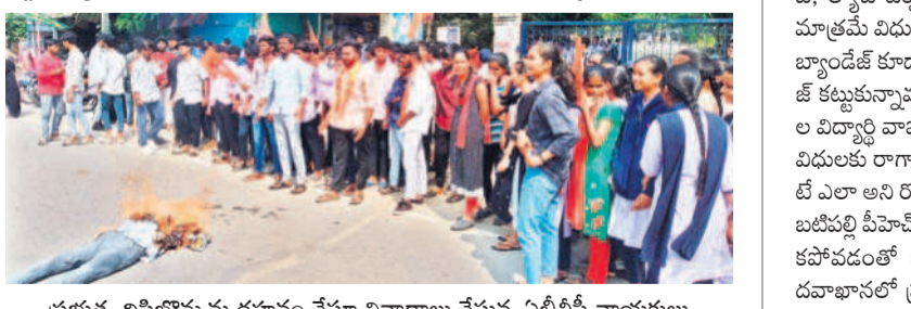
ప్రభుత్వ దిక్కు బిచ్చును దహనం చేస్తూ నివాదాలు చేస్తున్న ఏపీబీవీ నాయకులు

మహబూబ్ నగర్ విద్యా ఖాతా, నవంబర్ 4 : రాష్ట్రంలో పెండింగ్ లో ఉన్న 7,500 కోట్ల స్కాలర్ షిప్లు బకాయిలు వెలుబడి విడుదల చేయాలని ఏపీబీవీ నాయకులు ప్రభుత్వాన్ని డిమాండ్ చేశారు. సోమవారం ఉండవెల్లి కేంద్రంలోని కళాశాల ఎదుట రాష్ట్ర ప్రభుత్వ దిక్కు బిచ్చును దహనం చేశారు. ఈ సందర్భంగా