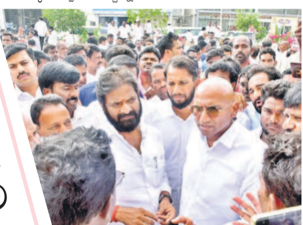
రైతులతో మాట్లాడుతున్న మాజీ మంత్రి శ్రీనివాస్ గౌడ్, ఆర్ఎస్ ప్రవీణ్