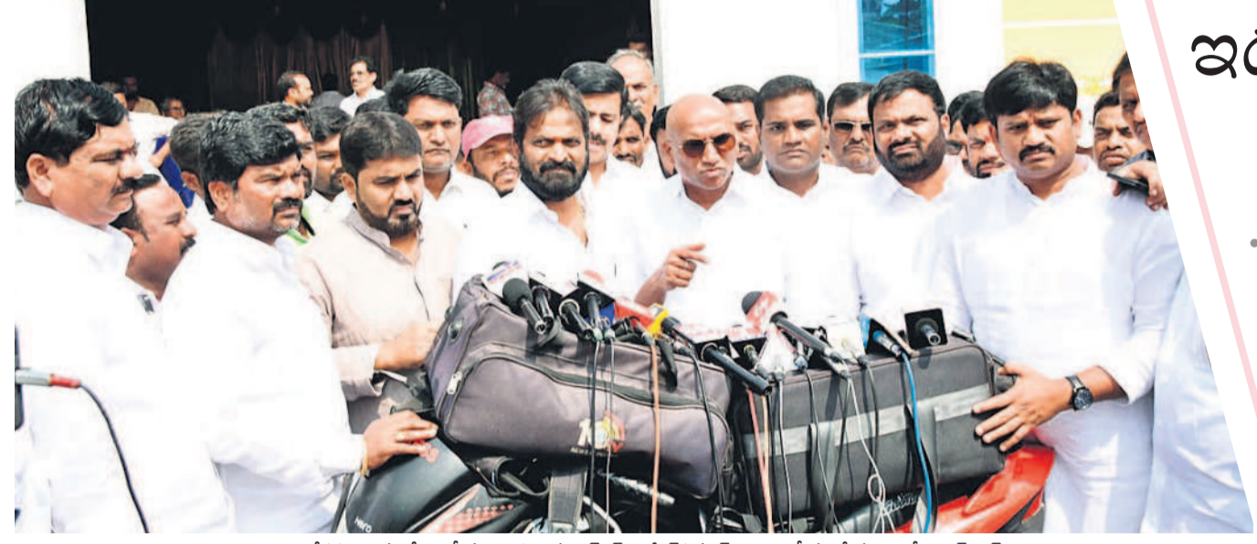
విలేజుల సమావేశంలో మాట్లాడుతున్న ఆర్ఎస్ ప్రవీణ్ కుమార్, చిత్రంలో మాజీ మంత్రి శ్రీనివాస్ గౌడ్