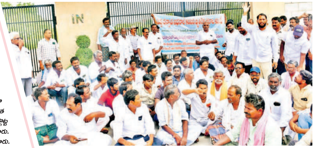
జోగుళాంబ గద్వాల కలెక్టరేట్ ఎదుట ధర్నా చేస్తున్న రైతులు

నవాబేపేట పోలీస్ స్టేషన్ లో నివాదాలు చేస్తున్న మాజీ సర్పంచులు పెండింగ్ బిల్లులు మంజూరు చేయాలంటూ అసెంబ్లీ ముఖ్యమంత్రి వెళ్తున్న మాజీ సర్పంచులను పోలీసులు అదుగుతున్నారని అభిప్రాయపడ్డారు. సోమవారం ఉమ్మడి మహబూబ్ నగర్ జిల్లా వ్యాప్తంగా పలువురిని ముందస్తుగా అరెస్ట్ చేశారు. ఈ సందర్భంగా పలువురు మాట్లాడుతూ గతంలో గ్రామాలాభివృద్ధికి సొంత డబ్బులు ఖర్చు చేశామని, ప్రభుత్వం మారడంతో కాంగ్రెస్ సర్కారు పైనలను ఎగ్జిక్యూషన్ లోకి పంపిస్తారని, పనులు లోకార్డులు చూసి డబ్బులు ఇవ్వాలని డిమాండ్ చేశారు. అసంతోషం వారిని పోలీస్ స్టేషన్లకు తీసుకెళ్లి సొంత పూజీకత్తుపై విడుదల చేశారు.