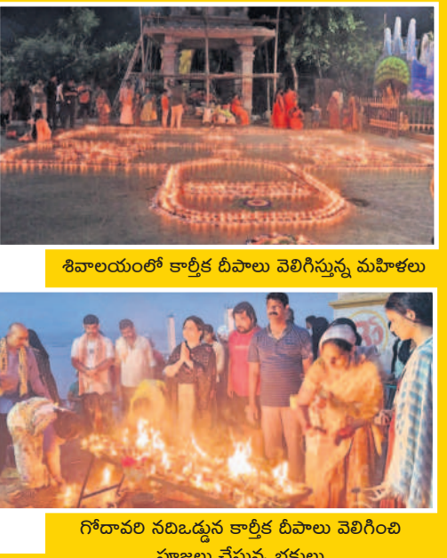
గోదారం నది ఒడ్డున కార్మిక దీపాలు వెలిగించి పూజలు చేస్తున్న భక్తులు