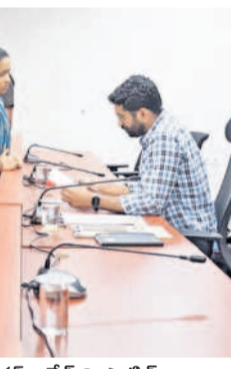
విజ్ఞప్తులు స్వీకరిస్తున్న కలెక్టర్ జితేశ్ వి పాటిల్

కొత్తగూడెం టౌన్, నవంబర్ 4 : అపరిష్కృతంగా ఉన్న తమ సమస్యలపై బాధితులు సమర్పించిన వినతులను పరిశీలించి, త్వరితగతిన పరిష్కరించాలని భద్రాద్రి కలెక్టర్ జితేశ్ వి పాటిల్ సంబంధిత శాఖల అధికారులను ఆదేశించారు.