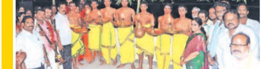
గోదారం తీరంలో నది హారతి ఇస్తున్న అర్చకులు

భద్రాచలం, నవంబర్ 4 : కార్మిక మానసందర్భంగా తొలి సోమవారం భద్రాచలంలోని పవిత్ర గోదారం నదీ తీరం దీపపుకాంతలతో మురిసిపోయింది.