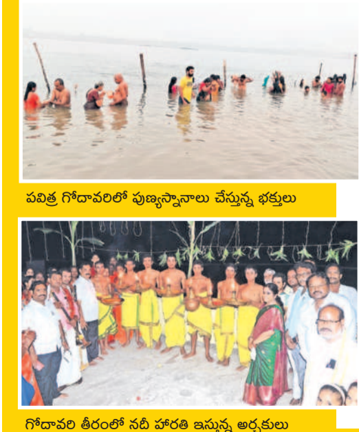
గోదారం తీరంలో నది హారతి ఇస్తున్న అర్చకులు