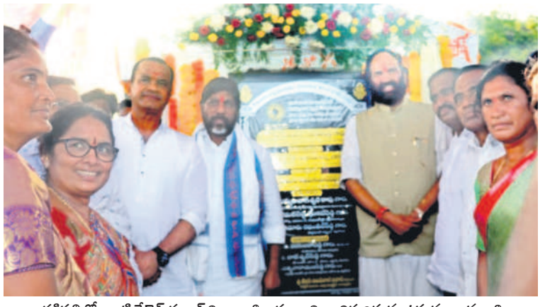
గడ్డిపల్లిలో ఇంటిగ్రేటెడ్ స్కూల్ నిర్మాణ శిలాపలకాన్ని ఆవిష్కరిస్తున్న ఉప ముఖ్యమంత్రి భట్టి విక్రమార్య మంత్రులు ఉత్తమ్, వెంకటరెడ్డి, తదితరులు