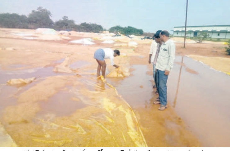
కనగల్ మండల కేంద్రంలోని ఇకేమీ సెంటర్లో వర్షానికి కొట్టుకుపోయిన ధాన్యం