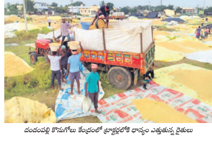
దండంపల్లి కొనుగోలు కేంద్రంలో ట్రాక్టర్లలోకి ధాన్యం ఎత్తుతున్న రైతులు