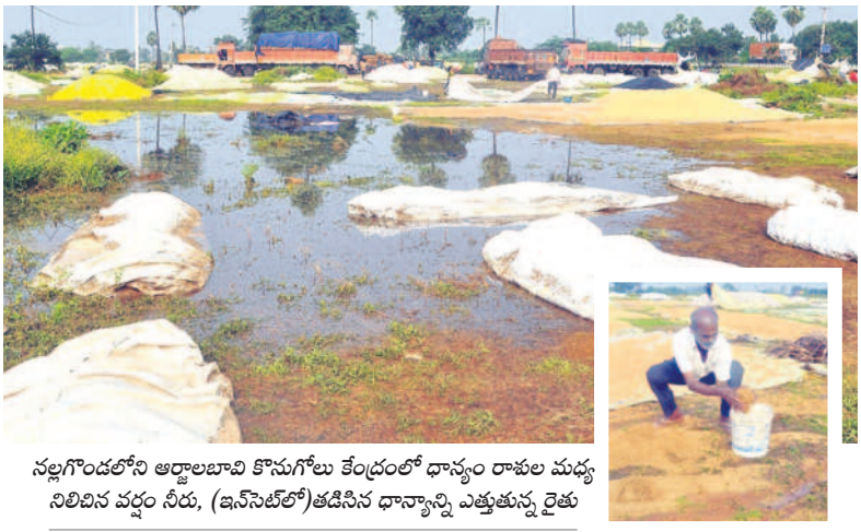
నల్లగొండలోని అర్బులబావి కొనుగోలు కేంద్రంలో ధాన్యం రాశుల మధ్య నిలివిన పద్దం నీరు, (ఇన్వెంటరీ) తడిసిన ధాన్యాన్ని ఎత్తుతున్న రైతు