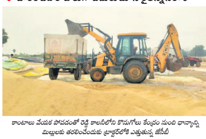
కాంటాలు వేయక పోవడంతో రెడ్డి కాలనీలోని కొనుగోలు కేంద్రం నుంచి ధాన్యాన్ని మిల్లులకు తరలింపేందుకు ట్రాక్టర్లలోకి ఎత్తుతున్న జేసీబీ

కేంద్రాల్లో ప్రారంభం కాని కాంటాలు.. నల్లగొండ రూరల్, నవంబర్ 3 : పల్లెల్లో ఎక్కడ నలుగురు కలిసి మాట్లాడుకున్నా కొనుగోలు కేంద్రాల్లో చక్కగా ధాన్యం కొంటలేరని. కొన్నా వెంటనే డబ్బులు పడుతారనే.. గత ప్రభుత్వం సకాలంలో వెంటనే ధాన్యం డబ్బులు వేసే దనే ముచ్చటలే వినిపిస్తున్నాయి. కాంగ్రెస్ ప్రభుత్వం గత నెల దసరా తర్వాత కొనుగోలు కేంద్రాలు ప్రారంభించినా ఎక్కడా సక్రమంగా కొనుగోళ్లు జరుగడం లేదు. ధాన్యం రాశులు మ్యాచర్ వచ్చినప్పటికీ సెంటర్లకు మిల్లులు కేటాయింప లేదు. అరకొర లారీల రావడం, పచ్చిన లారీలను గోదాముల్లో సకాలంలో దిగుమతి చేసుకోకపోవడంతోపాటు అకాల వర్షంతో ధాన్యం తడిసి రైతులు ఇబ్బందులు ఎదుర్కొంటున్నారు. ఇలానే ఉంటే ఆగమై రోడ్డు పడుతామనే ఉద్దేశంతో రైతులను ధాన్యం కొనుగోలు కేంద్రాలకు తీసుకొచ్చిన ధాన్యాన్ని తిరిగి ట్రాక్టర్లకు ఎత్తుకొని మిల్లులకు తరలిస్తున్నారు. కొందరు రైతులు కూలీల ద్వారా ట్రాక్టర్ల నింపుతుండగా, మరి కొందరు రైతులు జేసీబీ సహాయంతో ట్రాక్టర్ల నింపు మిల్లులకు తరలించారు. నల్లగొండ మండలంలోని దండంపల్లి గ్రామంలో ఏర్పాటు చేసిన ధాన్యం కొనుగోలు కేంద్రంలో సుమారు 10 ట్రాక్టర్లలో 400 క్వింటాళ్ల ధాన్యం, రెడ్డి కాలనీ కొనుగోలు కేంద్రంలో 8 ట్రాక్టర్లలో 320 క్వింటాళ్ల మేర మిల్లులకు రైతులు తరలింతున్నారు. ఇలా అయితే మద్దతు ధర రాదని తెలిసినా కొనుగోలు కేంద్రాల్లోనే ఉంటే పెట్టిన పెట్టుబడి కూడా వెళ్లే పరిస్థితి ఉండడం రైతులు వాపోయారు.