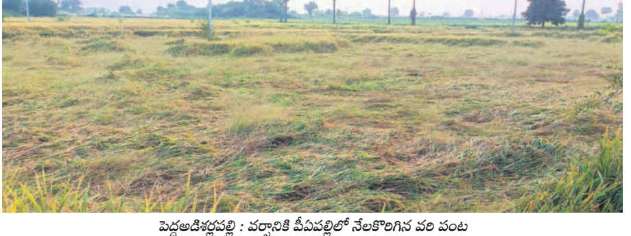
పెద్దఅడిగిపల్లి : వర్షానికి వీచిపల్లిలో నేలకొలిగిన వరి పంట

కేంద్రాల్లో తడిసిన ధాన్యం కేటేపల్లి : మండల పరిధిలోని వివిధ గ్రామాల్లో ఆదివారం తెల్లవారజామున కురిసిన వర్షానికి కోత దశకు వచ్చిన పది పొలాలు నేలవా లాయి. కేంద్రాల్లో పోసిన ధాన్యం రాశులు తడిసి ముద్దయ్యాయి. ధాన్యం తడవడంతో రైతులు తీవ్ర ఇబ్బందులు పడ్డారు. ఉదయం పూట పట్టాలు వేసి ధాన్యాన్ని ఆర బెట్టి ప్రయత్నం చేశారు. అలాగే వర్షానికి ఏరియండ్ల సిద్ధంగా ఉన్న పత్తి చేలపై తడిసింది.