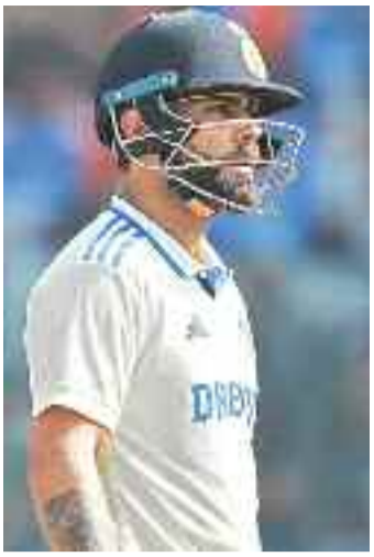
నమస్తే తెలంగాణ క్రీడావిభాగం

కారణం అని చెప్పక తప్పదు. న్యూజిలాండ్ తో సిరీస్లో రోహిత్.. 6 ఇన్నింగ్స్లో కలిపి 15.17 సగటుతో 91 పరుగులు చేసి కోట్ల 15.53 సగటుతో 93 పరుగులు చేశాడు. గత 10 ఇన్నింగ్స్లో రోహిత్ స్కోర్లు 6, 5, 23, 8, 23, 2, 52, 0, 8, 18, 11 గా ఉంటే కోట్ల 6, 17, 47, 29, 0, 70, 1, 17, 4, 1 చేశాడు. వీరి వైఖరిని గణాంకాలు స్పష్టంగా చెబుతున్నాయి. స్పిన్ ను బాగా ఆడగలిగే ఈ ఇద్దరూ గత మూడు మ్యాచ్ లలోనూ దారుణంగా చతికిలపడ్డారు. గిల్, జైస్మిల్, పంత్ వంటి కుర్రాళ్లు స్పిన్ ను సమర్థవంతంగా ఎదుర్కుంటుంటే ఈ ఇద్దరు మాత్రం పంత్ వంటి తమ బలహీనతలను బయటపెడుతూ అత్యంత చెత్త ప్యాట్లతో పెవిలియన్ కు చేరారు. వ్యాపానికి ఈ టెస్టు సిరీస్ కు ముందు శ్రీలంక చేతిలో ఆడిన రెండు టెస్టులు ఓడి భారత్ కు వచ్చిన న్యూజిలాండ్ స్పిన్ ను అక్కడ తెలిపారు. పూజె టెస్టులో మాత్రమే ఆడినా మిచెల్ శాంట్లర్ తో పోర్టియో ఆజాజ్ వంటి, గ్లెన్ ఫిలిప్పి అంత ప్రమాదకరమైన స్పిన్ ను కౌంటర్ చేయడానికి రోహిత్, కోట్ల తంటాలు పడ్డారు. బోల్డర్ గవాస్కర్ వంటి కీలక సిరీస్ కు ముందు జరిగిన న్యూజిలాండ్ సిరీస్ లో ఈ ఇద్దరి దారుణ వైఫల్యంతో వీరి భవిష్యత్ కు కూడా ప్రమాదం పడింది. విడివిడి గడ్డపై చతికిలపడ్డా మౌస్ చూడనట్లు వదిలేసి అభిమానులు ఎండ్రోయిడ్లుగా ఆడుతున్న సాంతగడ్డపై ఇంత బాధ్యతాహీనతగా ఆడినా స్ట్రోబ్ లింగ్ పాతకస్థాయికి చేరింది. 'రోహిత్' గౌరవంగా జట్టు నుంచి తప్పకుండా వదిలివేసి, ఆస్ట్రేలియాలో కూడా ఇది పునరావృతమైతే వారిపై వేటు వేసి యువ ఆటగా మారాలని సుదీర్ఘ అనుభవం కలిగిన ఈ ద్వయం వైఫల్యం భారత ఓటమికి ప్రధాన